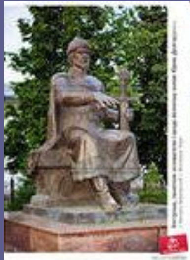
Юрий Долгорукий (отец А. Боголюбского)