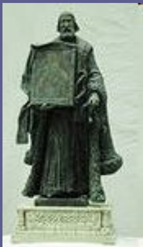
■ Андрей Боголюбский