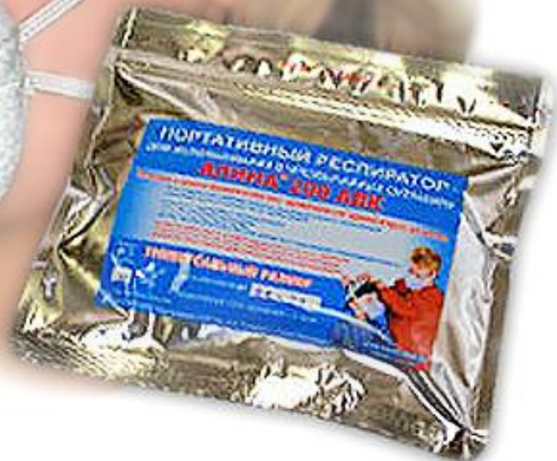
респиратор «Алина 200 АВК»