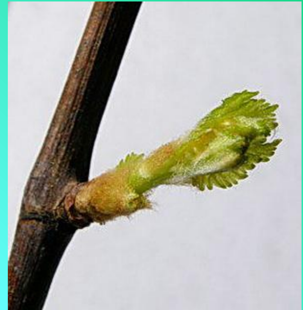
БОКОВАЯ (ПАЗУШНАЯ) ПОЧКА