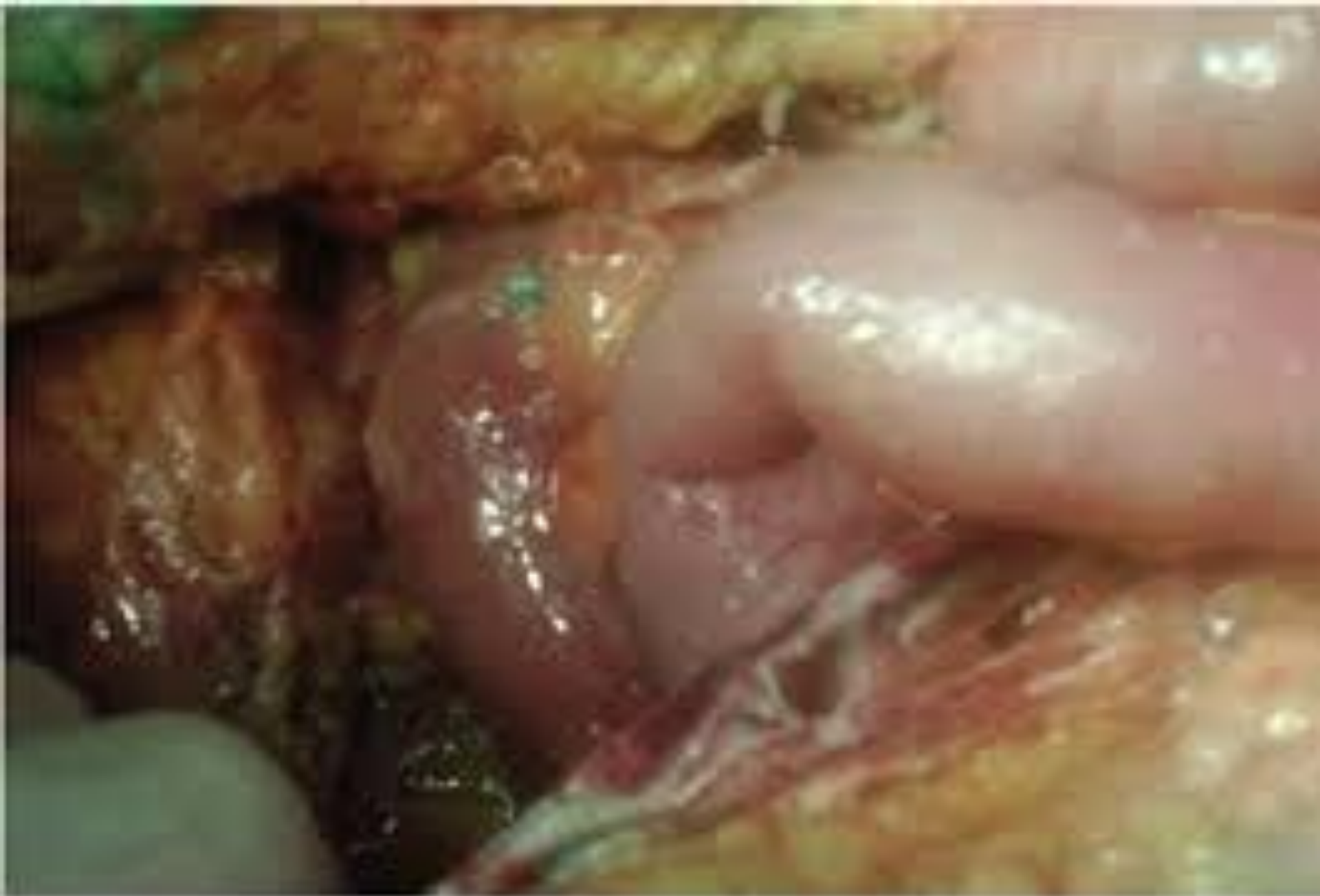
Рис. 2. Лапаротомия: разлитой гнойный перитонит