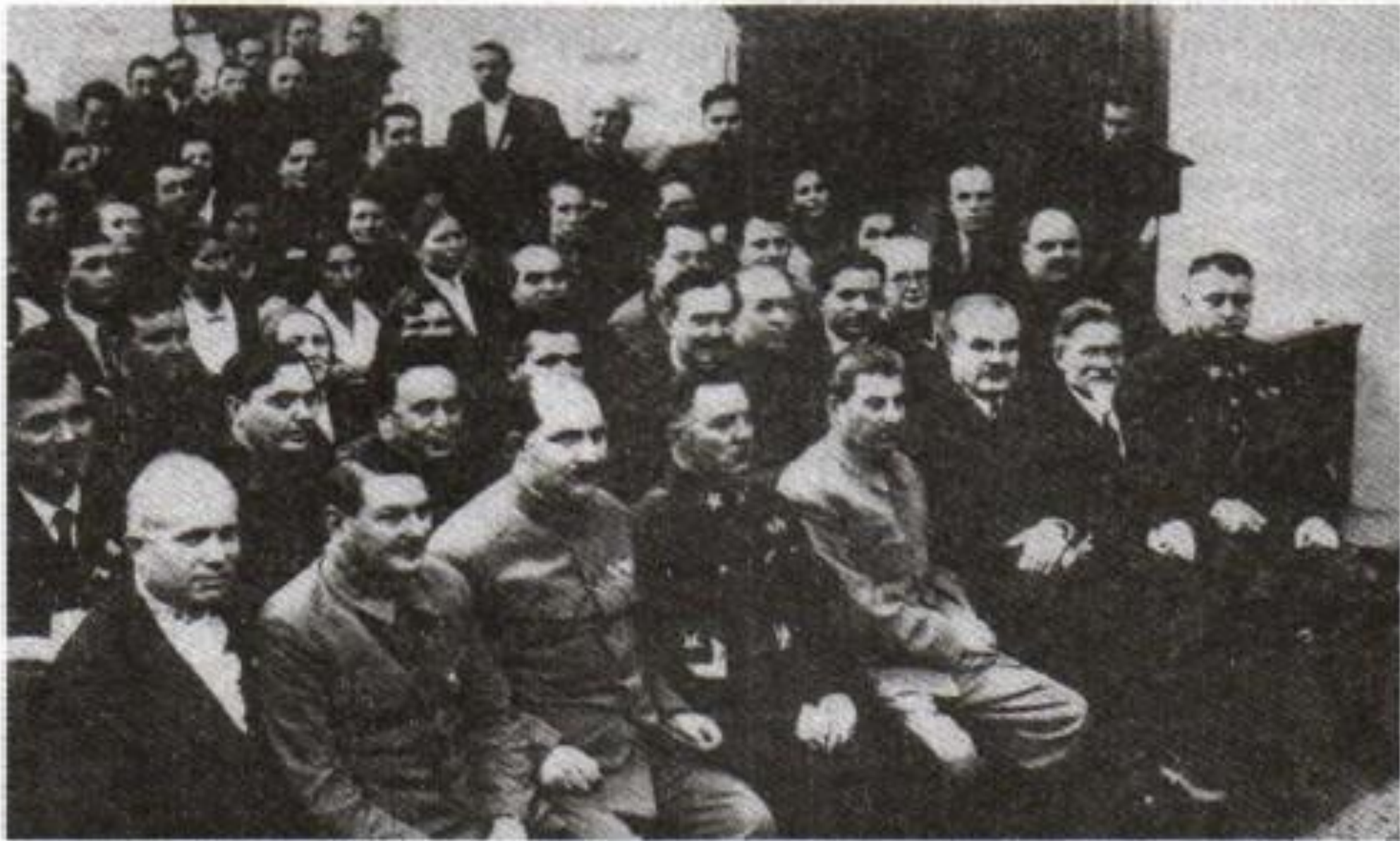
Руководители СССР в 1936 г. В первом ряду слева направо: Н. С. Хрущёв, А. А. Жданов, Л. М. Каганович, К. Е. Ворошилов, И. В. Сталин, В. М. Молотов, М. И. Калинин, М. Н. Тухачевский