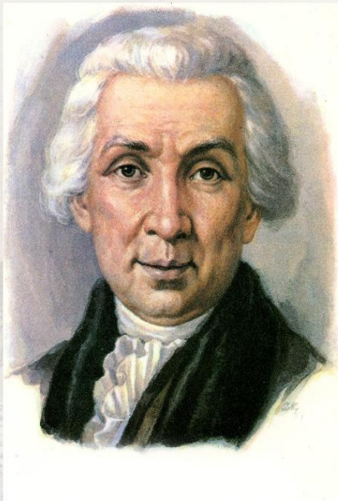
Гаврила Романович Державин (1743-1816гг)