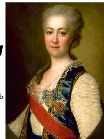
Директор Петербургской Академии наук Дашкова Екатерина Романовна 1744 - 1810

29 ноября 1783 года состоялось одно из первых заседаний Российской академии, на котором княгиня Е.Р. Дашкова предложила использовать новую букву «ё».