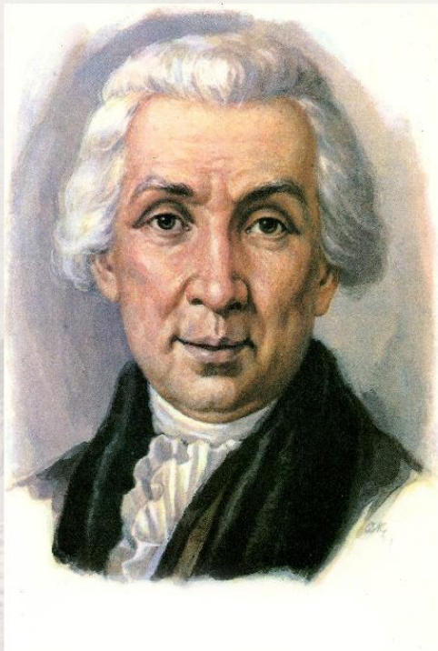
Гаврила Романович Державин (1743-1816гг)