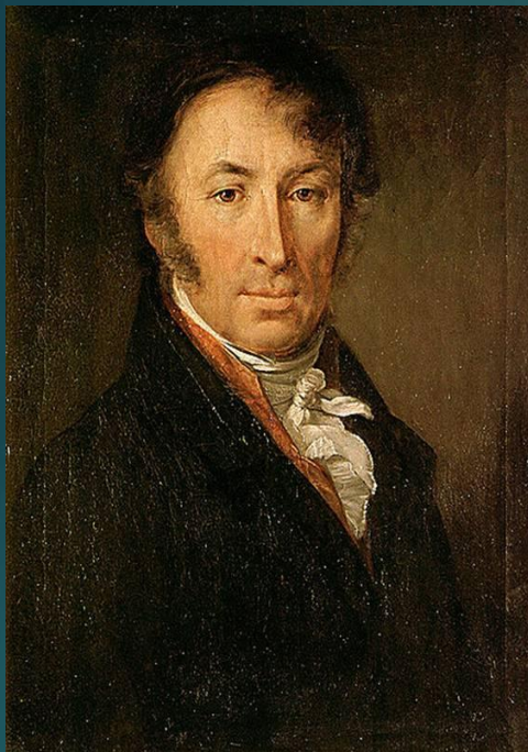
Николай Михайлович Карамзин (1766-1826). русский историк- историограф, писатель, поэт.

Существует две версии появления буквы «Ё» .