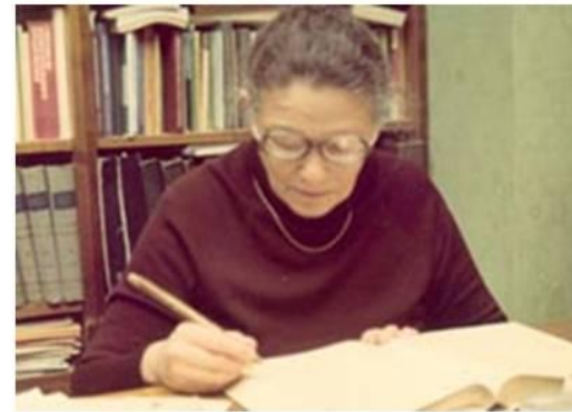
Н.Ю. Шведова (1916 – 2009)

Шведова Наталья Юльевна – выдающийся российский лингвист и лексикограф, академик РАН, доктор филологических наук, автор фундаментальных исследований по истории, грамматике, лексике и семантике русского языка.