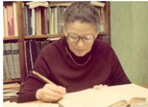
Н.Ю. Шведова (1916 – 2009)

Шведова Наталья Юльевна – выдающийся российский лингвист и лексикограф, академик РАН, доктор филологических наук, автор фундаментальных исследований по истории, грамматике, лексике и семантике русского языка.