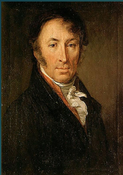
Николай Михайлович Карамзин (1766-1826). русский историк- историограф, писатель, поэт.

Существует две версии появления буквы «Ё» .