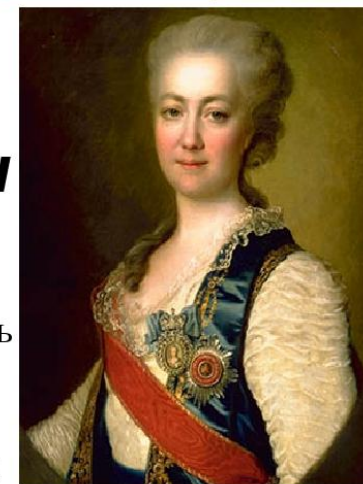
Директор Петербургской Академии наук Дашкова Екатерина Романовна 1744 - 1810

29 ноября 1783 года состоялось одно из первых заседаний Российской академии, на котором княгиня Е.Р. Дашкова предложила использовать новую букву «ё».