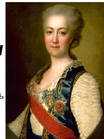
Директор Петербургской Академии наук Дашкова Екатерина Романовна 1744 - 1810

29 ноября 1783 года состоялось одно из первых заседаний Российской академии, на котором княгиня Е.Р. Дашкова предложила использовать новую букву «ё».