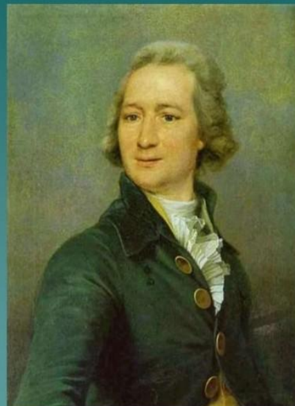
Дмитриев Иван Иванович (1760- 1837), поэт и драматург. Художник Д.Г.Левицкий.