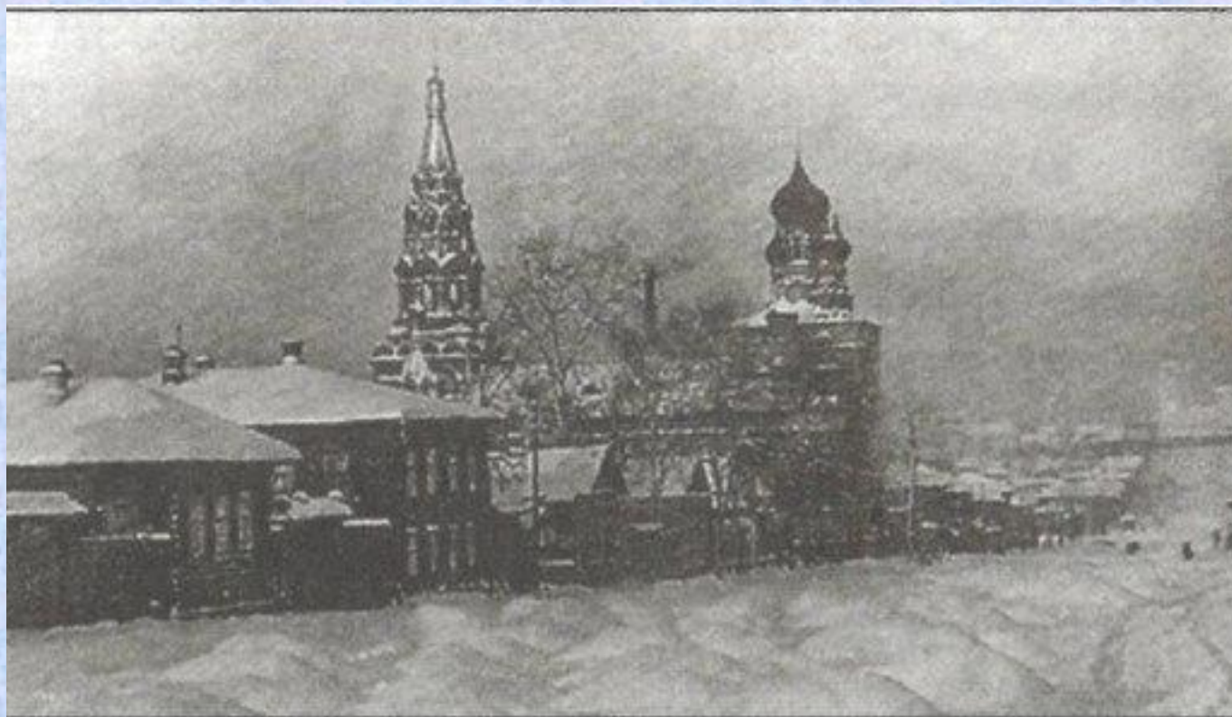
Храм Вознесения Господня (Феодосьевский). Пермь. 1920-е гг.