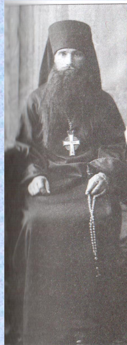
Игумен Таврион (Батозский), Пермь. 1928 г.