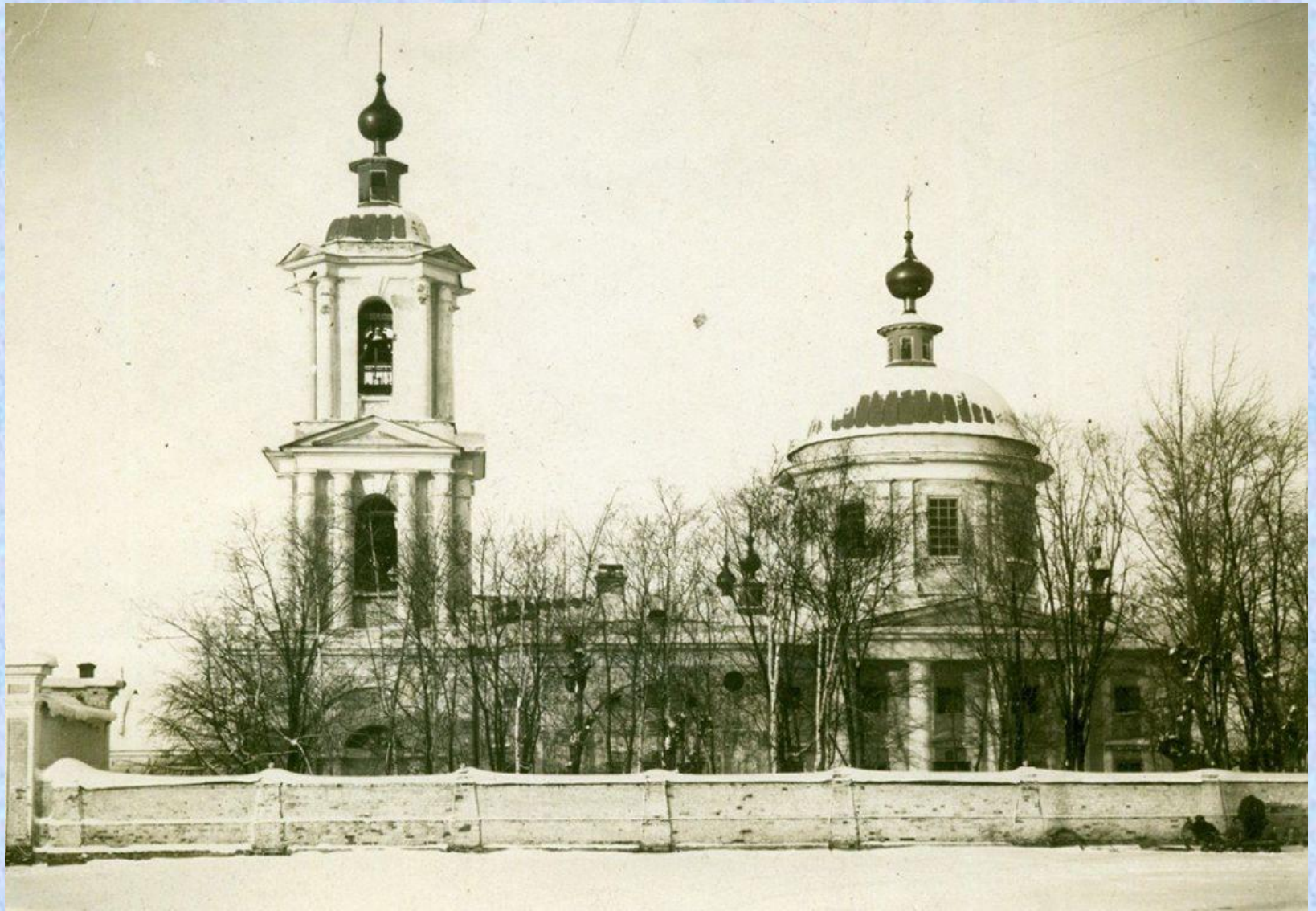
Свято – Троицкий собор