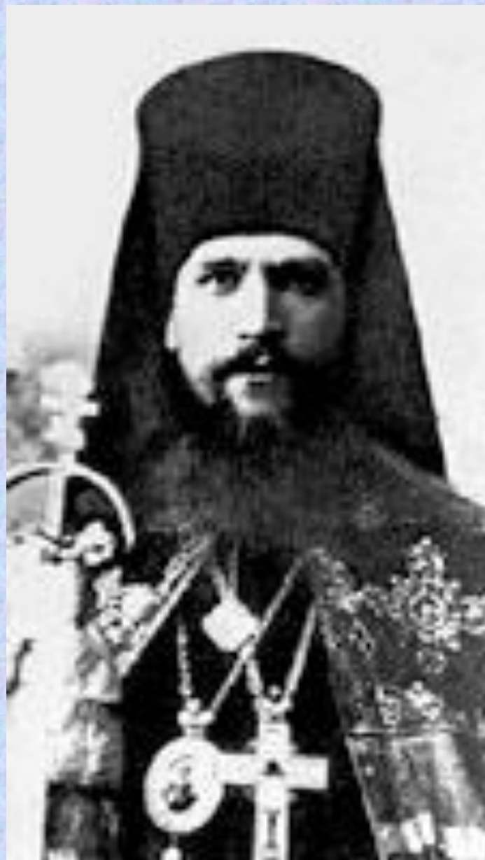
Епископ Павлин (Крошечкин)