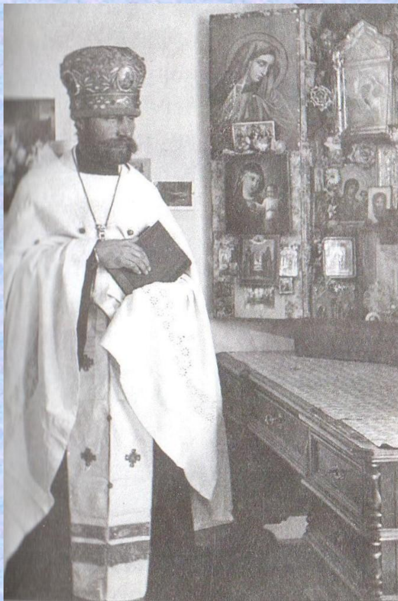
Архимандрит Таврион. Казахстан, пос. Фёдоровка. 1950 г.