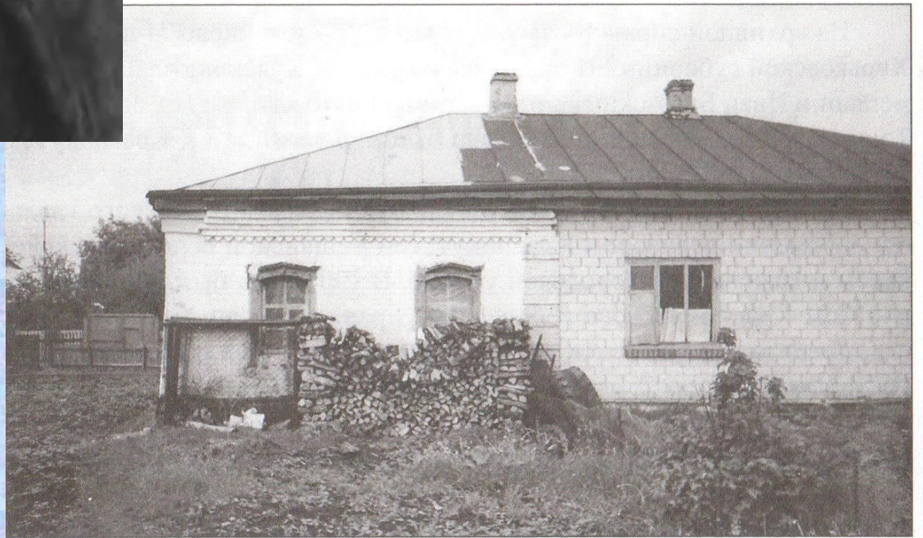
Родительский дом о. Тавриона в г. Краснокутске