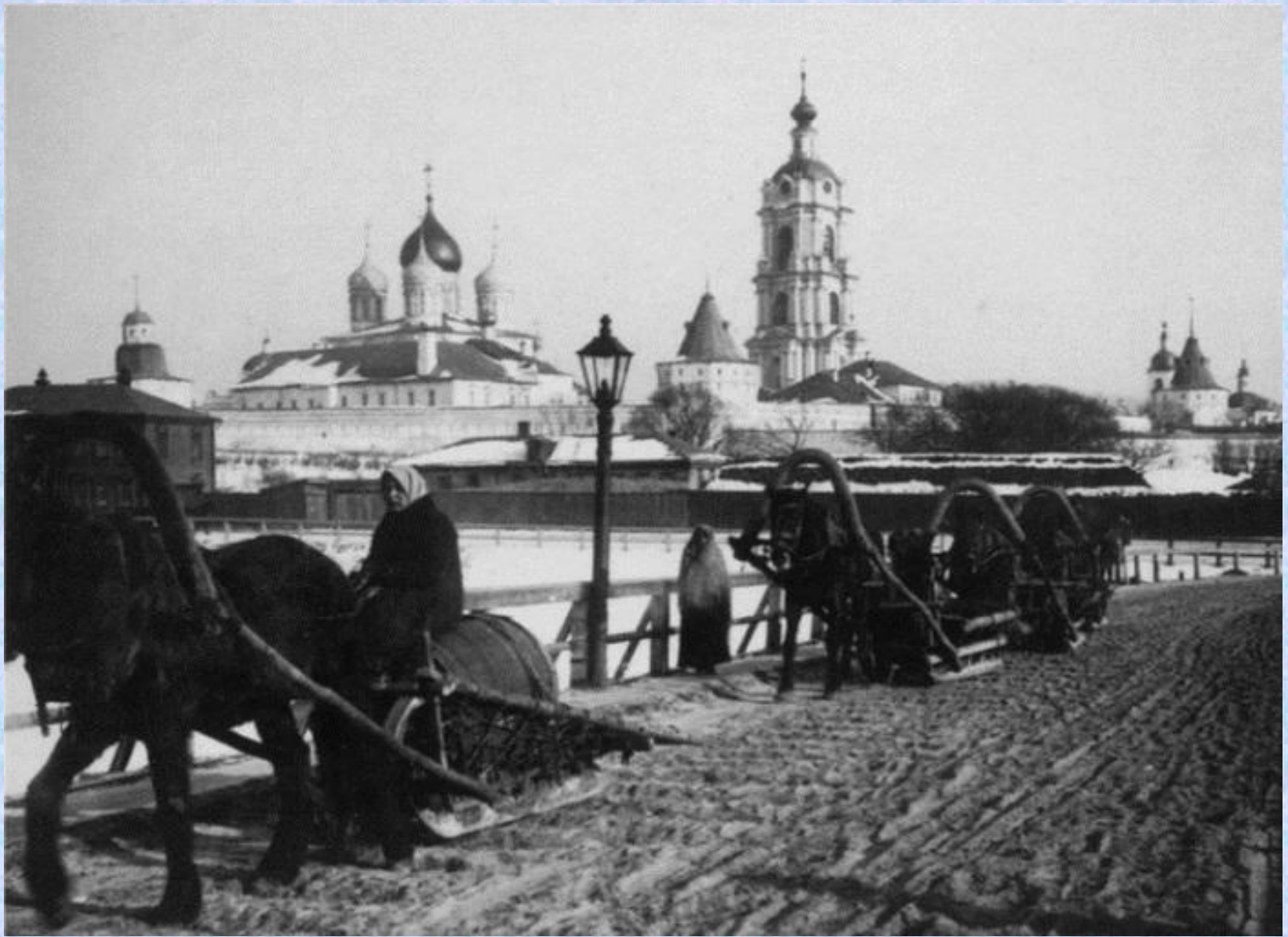
Московский Новоспасский монастырь