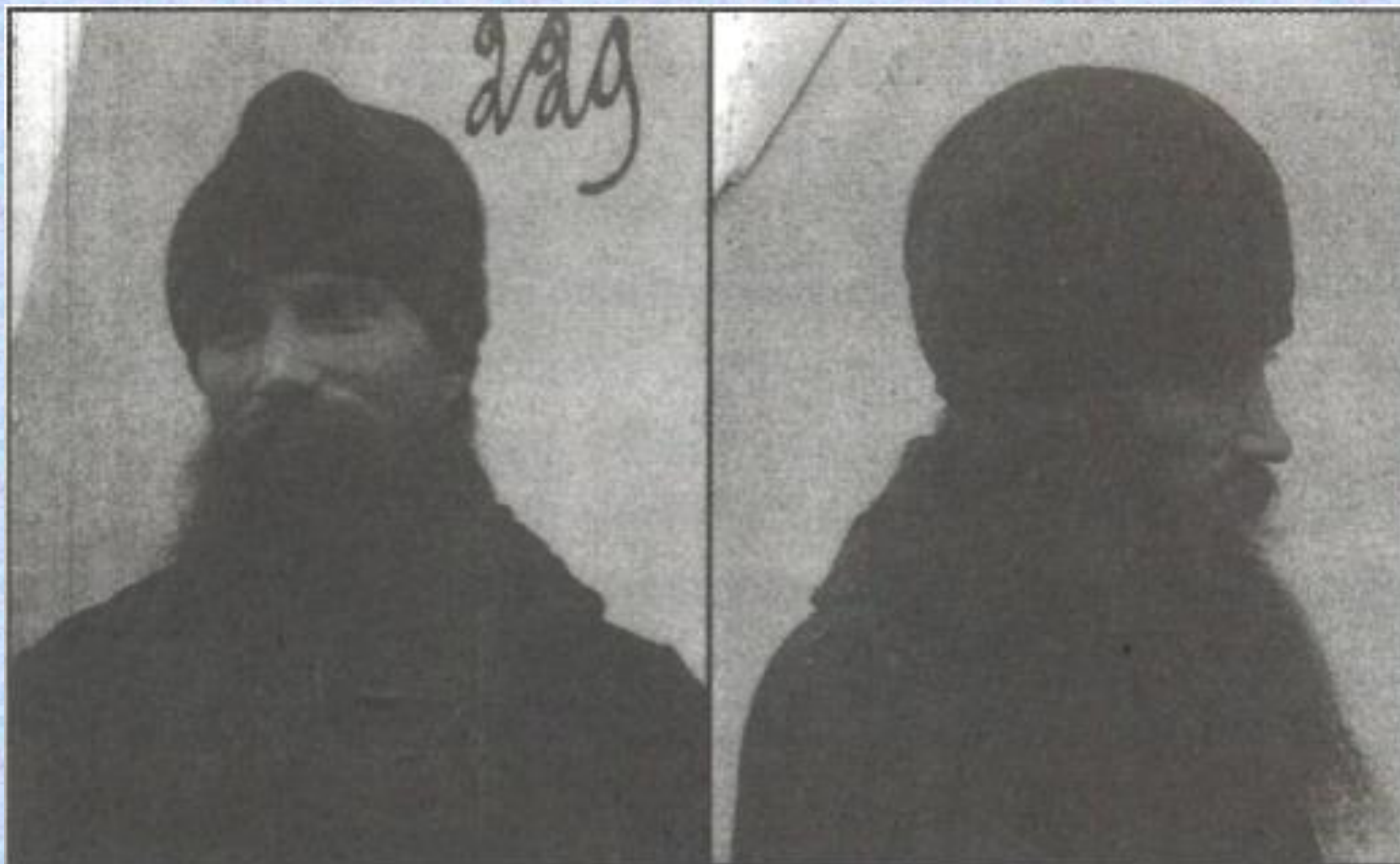
Архимандрит Таврион (Батозский). Из следственного дела № 8887 (ПермГАНИ). 1929 г., ноябрь