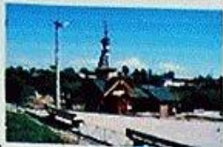
ИСТОЧНИК КАЗАНСКОЙ ИКОНЫ БОЖИЕЙ МАТЕРИ