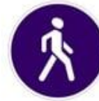
4.5 Пешеходная дорожка