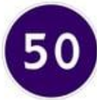
4.6 Ограничение минимальной скорости