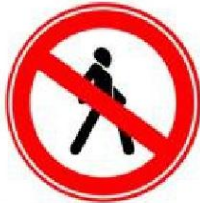
Движение пешеходов запрещено