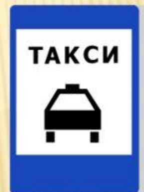
Место стоянки легковых такси