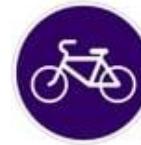
4.4 Велосипедная дорожка