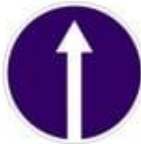
4.1.1 Движение прямо