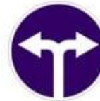
4.1.6 Движение направо или налево