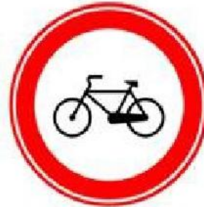
Движение на велосипедах запрещено