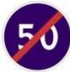
4.7 Конец ограничения минимальной скорости