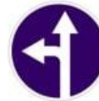
4.1.5 Движение прямо или налево