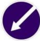
4.2.2 Объезд препятствия слева