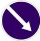
4.2.1 Объезд препятствия справа