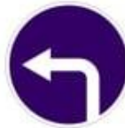
4.1.3 Движение налево