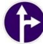
4.1.4 Движение прямо или направо