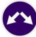
4.2.3 Объезд препятствия справа или слева