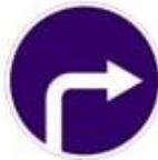
4.1.2 Движение направо