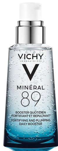
МИНЕРАЛ 89 ЕЖЕДНЕВНЫЙ ГЕЛЬ-БУСТЕР, УСИЛИВАЮЩИЙ УПРУГОСТЬ И УВЛАЖНЕНИЕ КОЖИ ЛИЦА