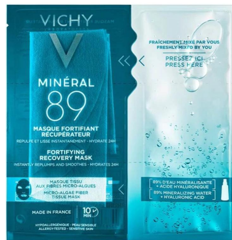
МИНЕРАЛ 89 УКРЕПЛЯЮЩАЯ ТКАНЕВАЯ МАСКА ДЛЯ УВЛАЖНЕНИЯ И ВОССТАНОВЛЕНИЯ КОЖИ ЛИЦА