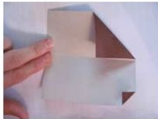
4. Загибаем другой маленький краешек угла