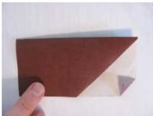
5. Складываем пополам