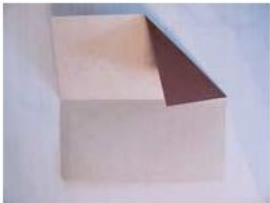
3. Загибаем один угол к середине