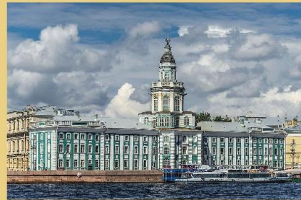
Первая российская академия наук, 1724 г.