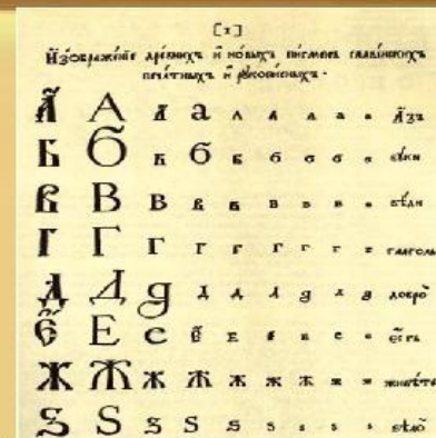
Гражданская азбука (гражданский шрифт), 1710 г.