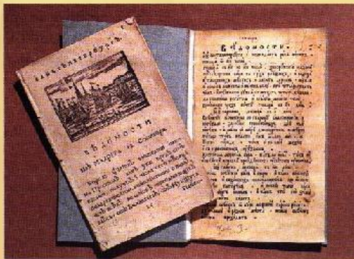
Первая русская газета «Ведомости», 1703 г.