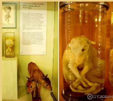
Кунсткамера-музей редкостей, 1714 год