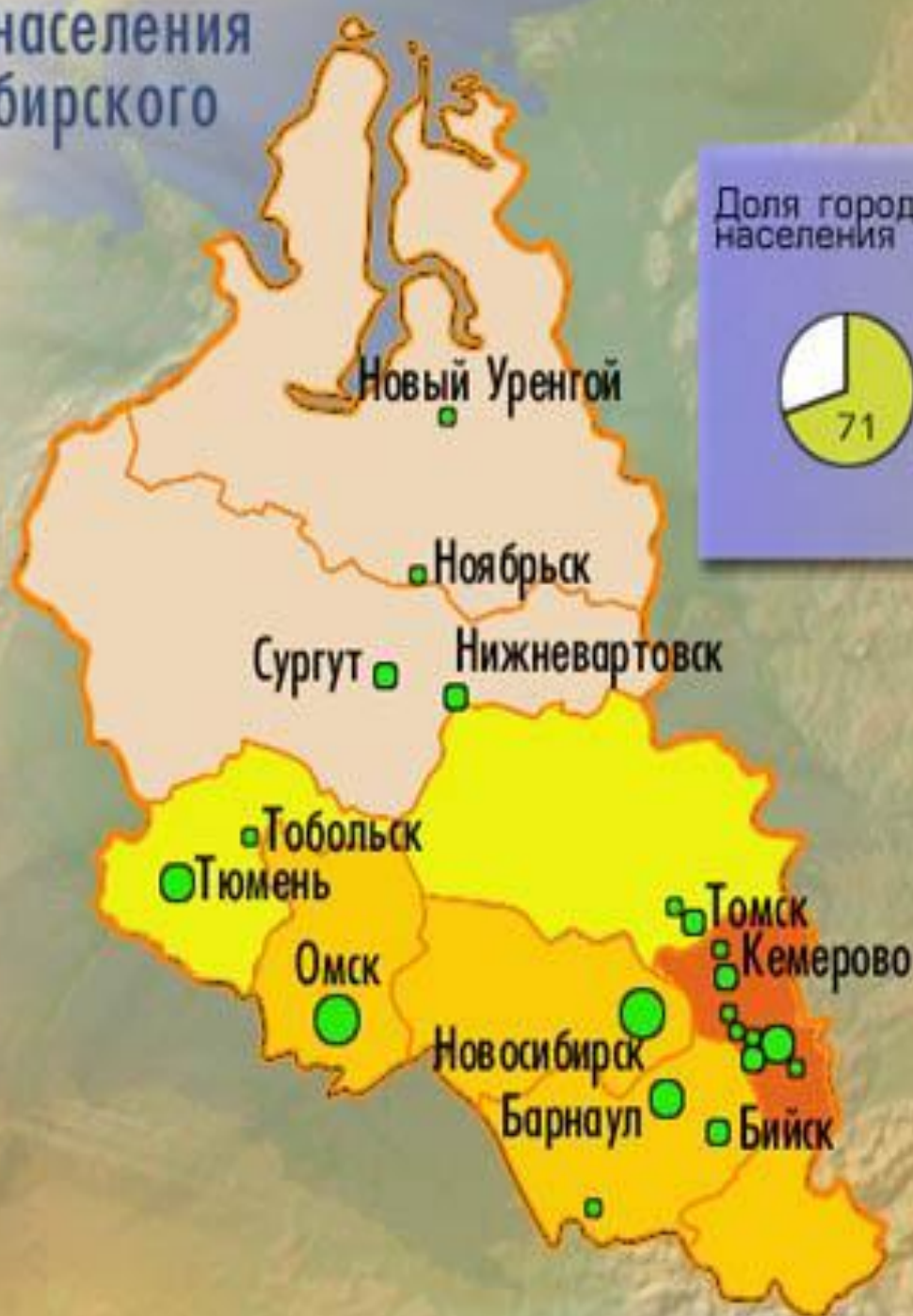
Доля городского населения