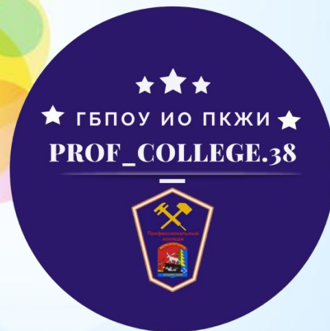
Фото Акция «#Профтех80»