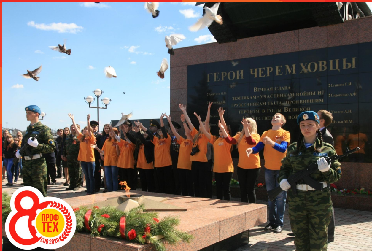
Государственное бюджетное профессиональное образовательное учреждение Иркутской области "Черемховский техникум промышленной индустрии и сервиса"