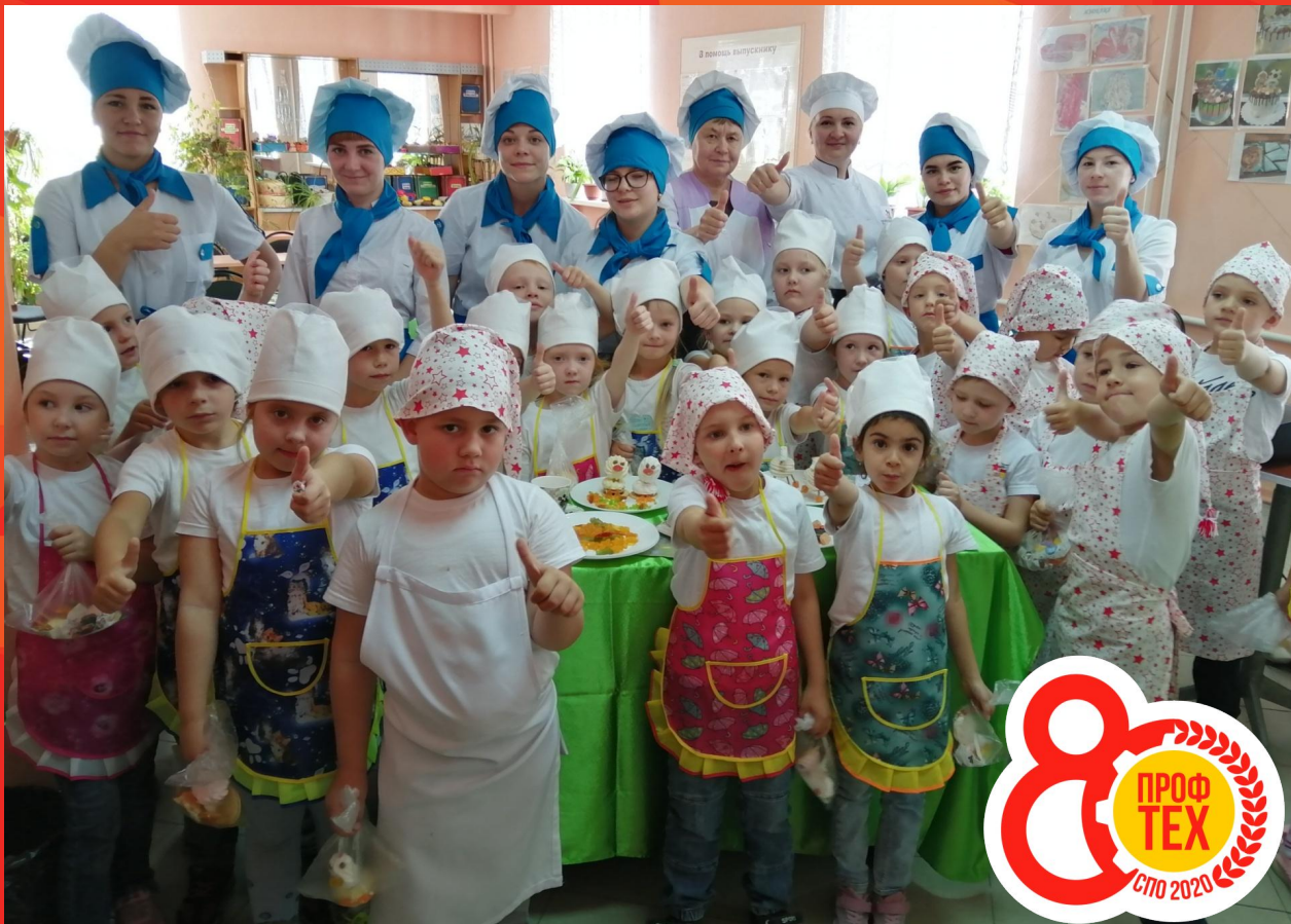
Государственное бюджетное профессиональное образовательное учреждение Иркутской области "Черемховский техникум промышленной индустрии и сервиса"