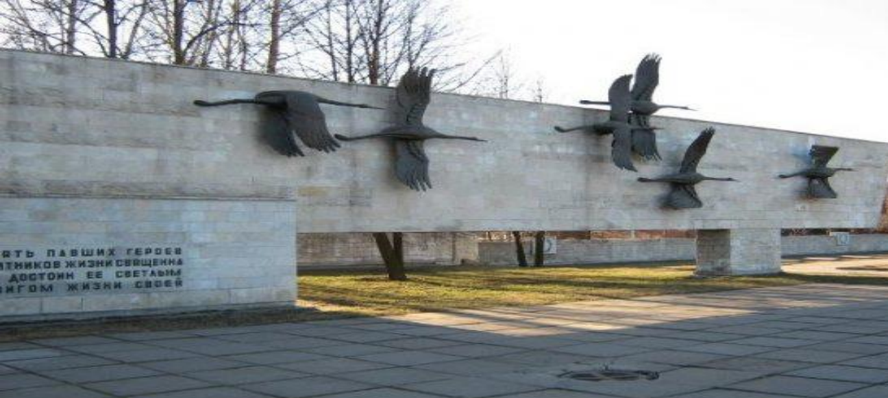
Санкт-Петербург Невский мемориал «Журавли». Открыт в 1980 г.