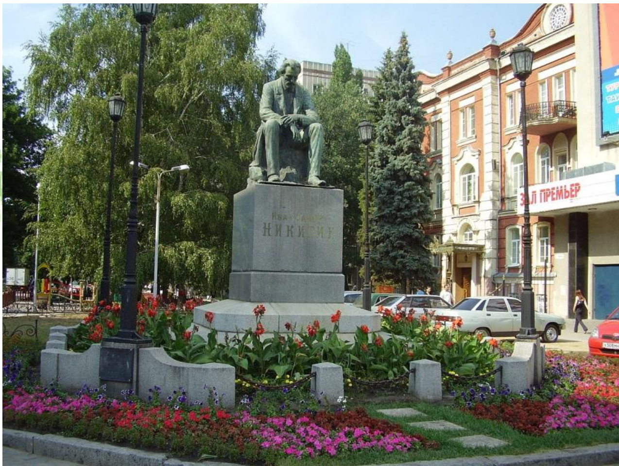
Памятник И.С.Никитину г. в Воронеже.