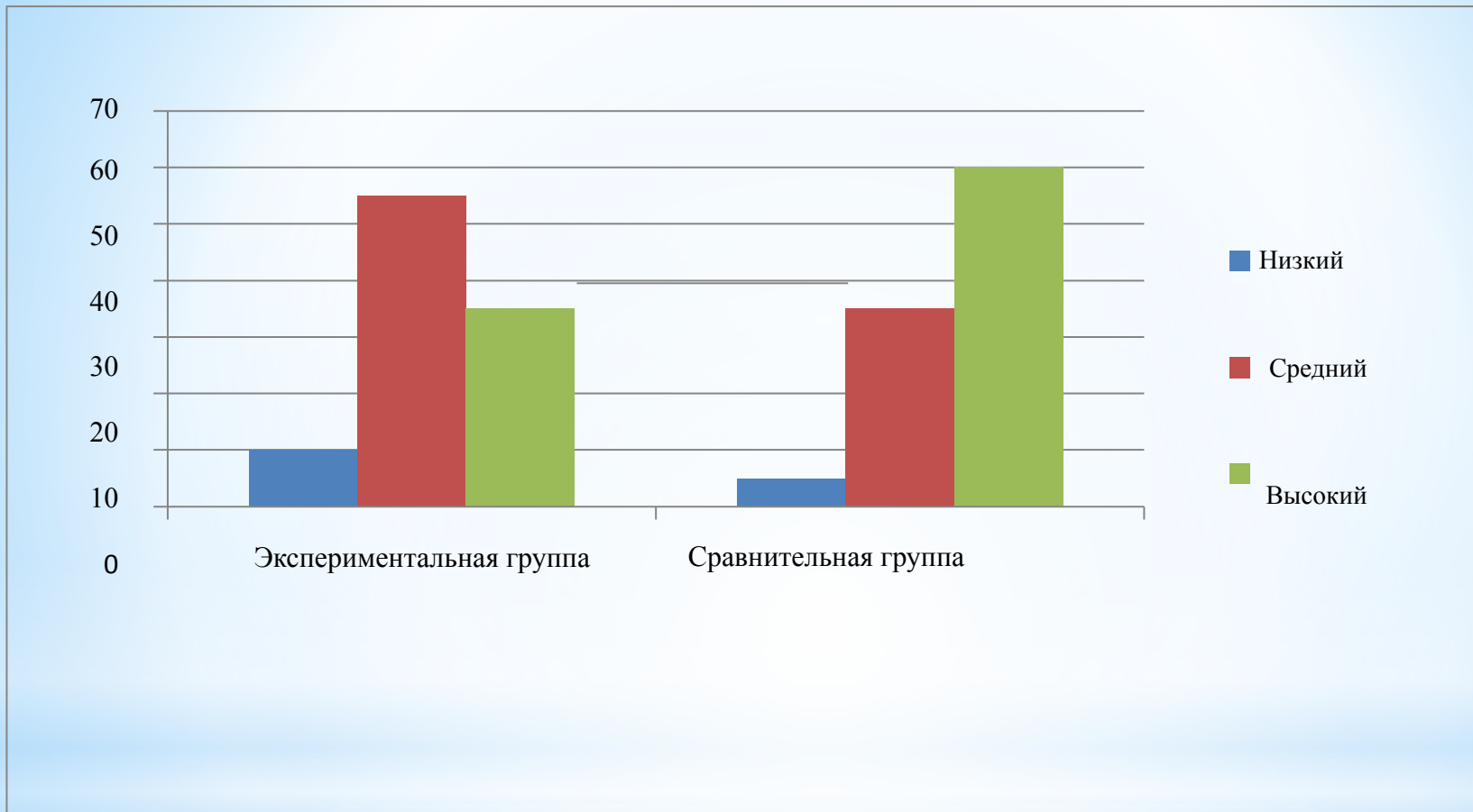
Рис.7. Уровень познавательного интереса дошкольников (%)