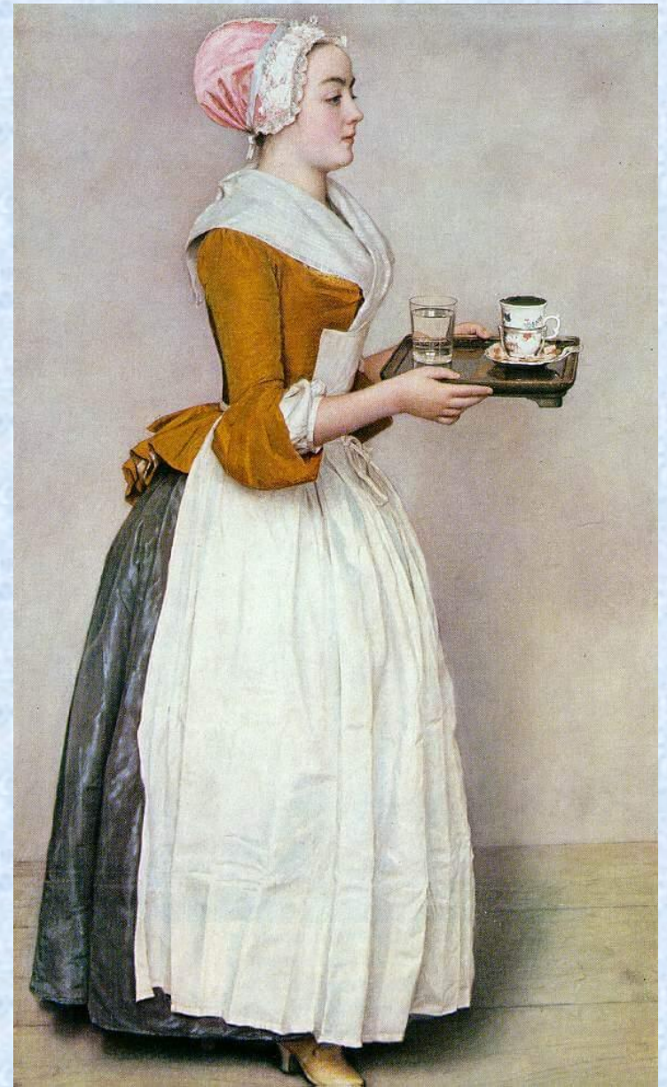
Шоколадница Жан-Этьен Лиотар