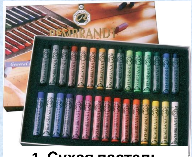
1. Сухая пастель