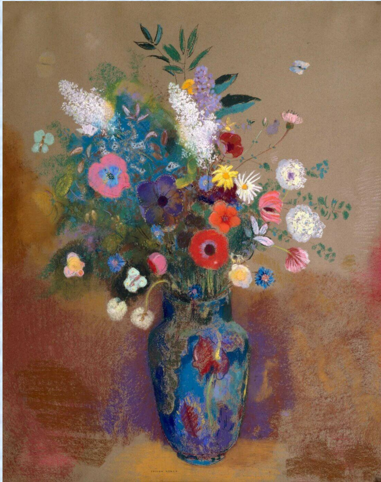
Букет цветов Одилон Редон

Техника пастели любима многими художниками.