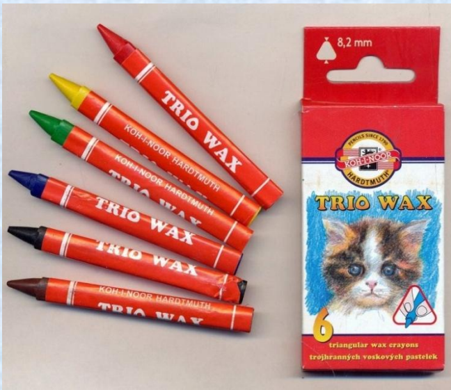
2. Восковая пастель