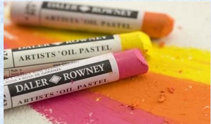
3. Масляная пастель