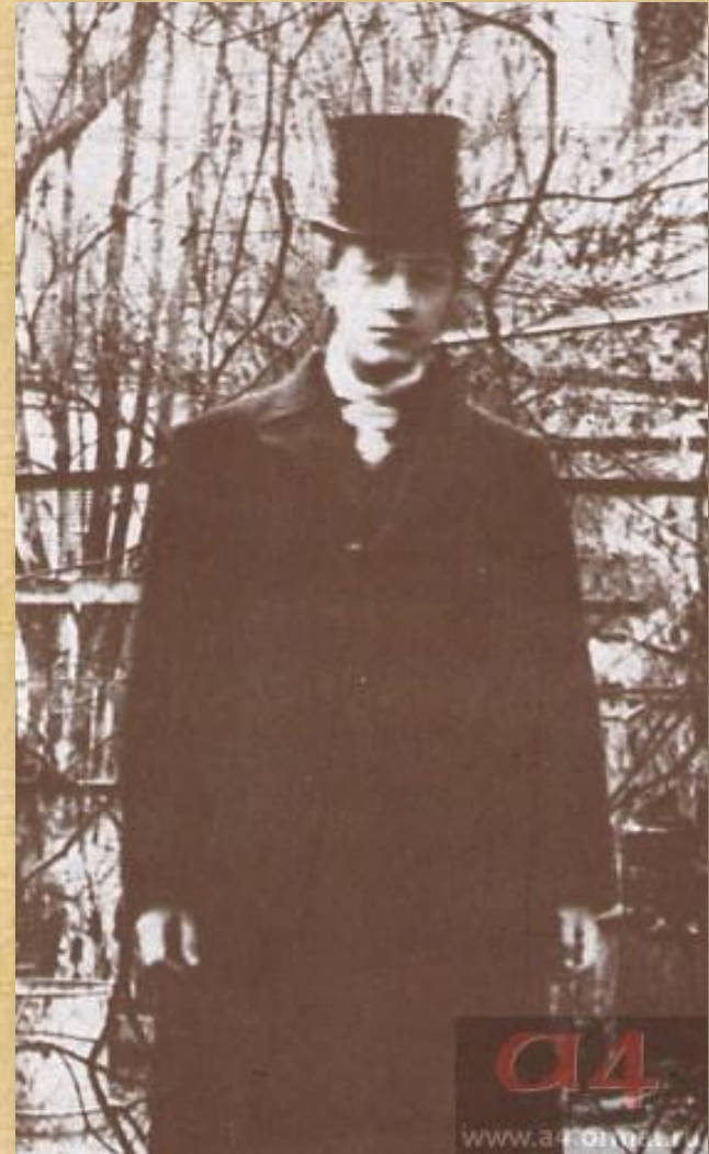
Н. Гумилёв в Париже

Николая Гумилева всегда тянуло в заморские страны, ему хотелось увидеть все, испытать новые чувства, а затем оформить свои впечатления в стихи. Он уехал в Париж, «душа требовала расстояний и впечатлений». Париж стал для Гумилева вторым домом. Сюда он приезжал очень часто, но стихи раздаривал другим городам, которые затмевали образ привычного Парижа.