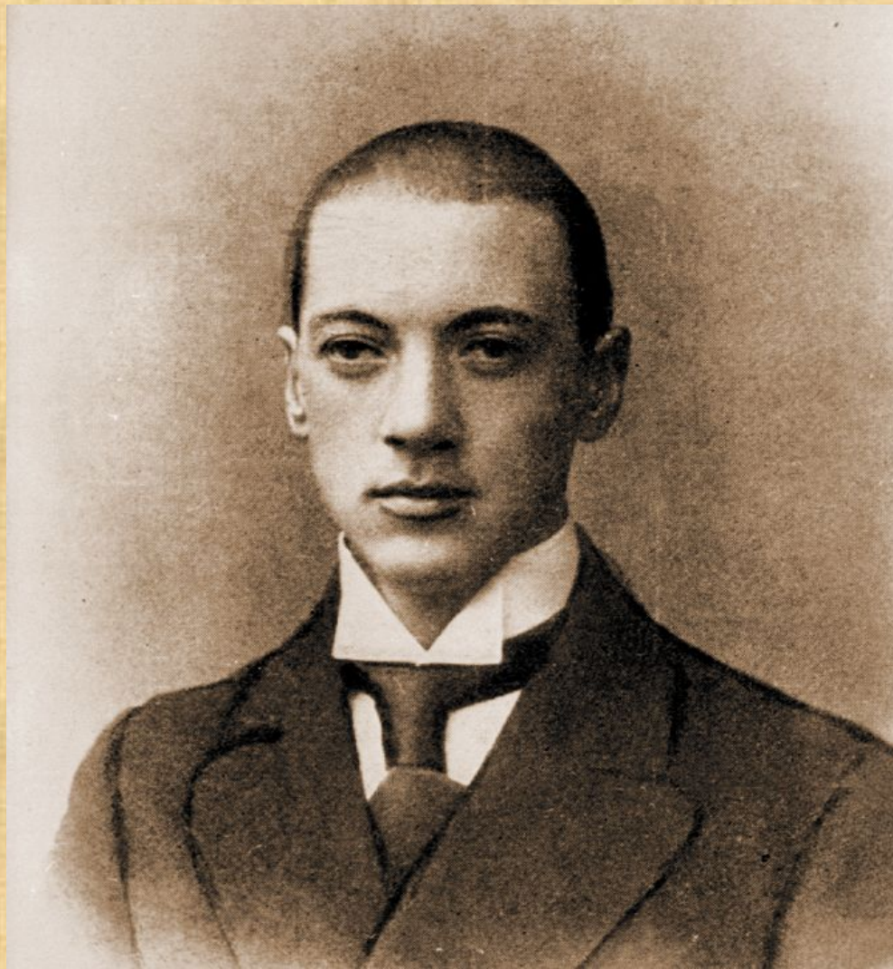
Николай Степанович Гумилев (1886-1921гг.)