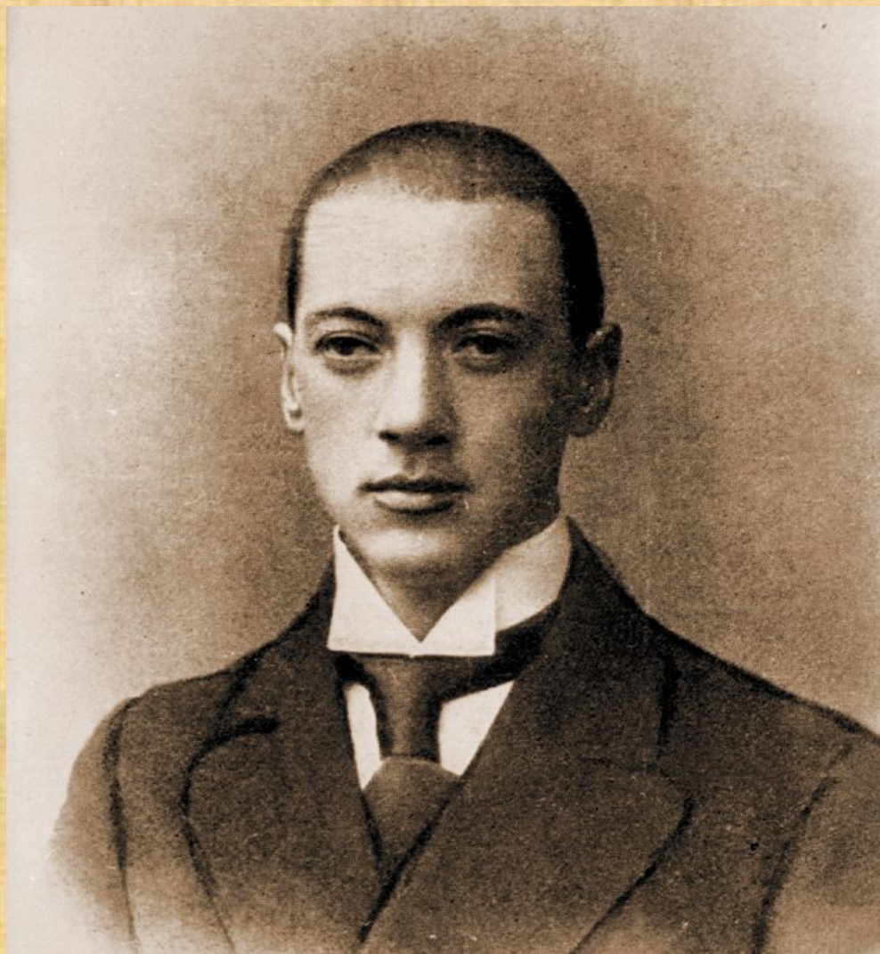
Николай Степанович Гумилев (1886-1921гг.)