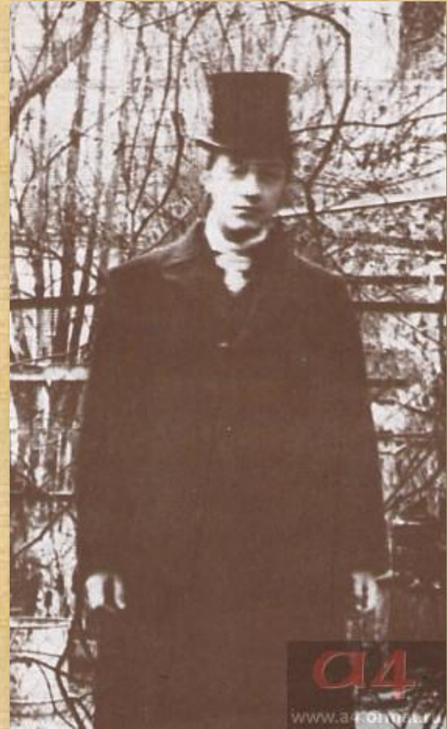
Н. Гумилёв в Париже

Николая Гумилева всегда тянуло в заморские страны, ему хотелось увидеть все, испытать новые чувства, а затем оформить свои впечатления в стихи. Он уехал в Париж, «душа требовала расстояний и впечатлений». Париж стал для Гумилева вторым домом. Сюда он приезжал очень часто, но стихи раздаривал другим городам, которые затмевали образ привычного Парижа.