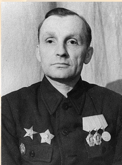
Георгий Семёнович Шпагин

В числе первых прибывших были Г. С. Шпагин с семьей, молодой Ф. И. Трещёв — будущий директор завода, Н. Ф. Макаров — автор знаменитого пистолета ПМ. Всего прибыло 3609 человек.