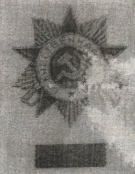
Орден Отечественной войны 1-й степени