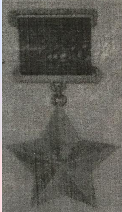
медали "Золотая Звезда"