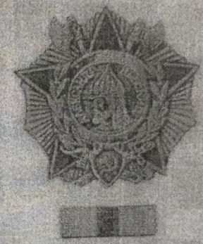
Орден Александра Невского