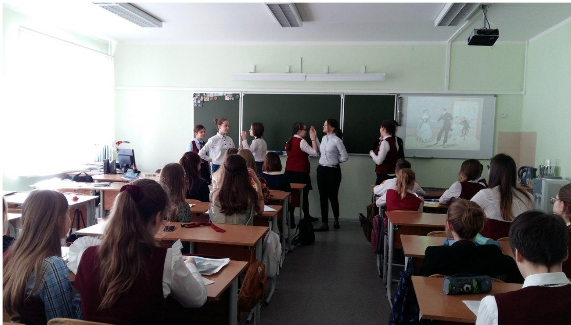
Тема проекта: Этикет на ассамблеях