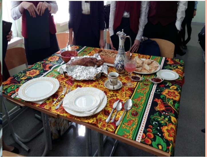
Тема проекта: Угощения XVIII – XIX вв.