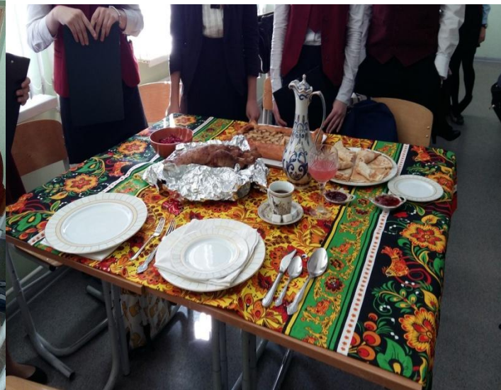
Тема проекта: Угощения XVIII – XIX вв.