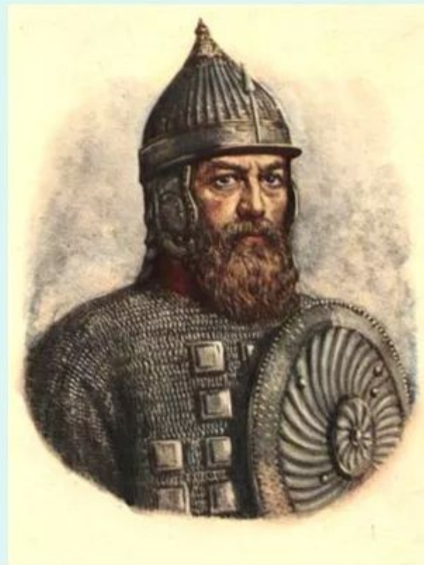
Князь Дмитрий Пожарский