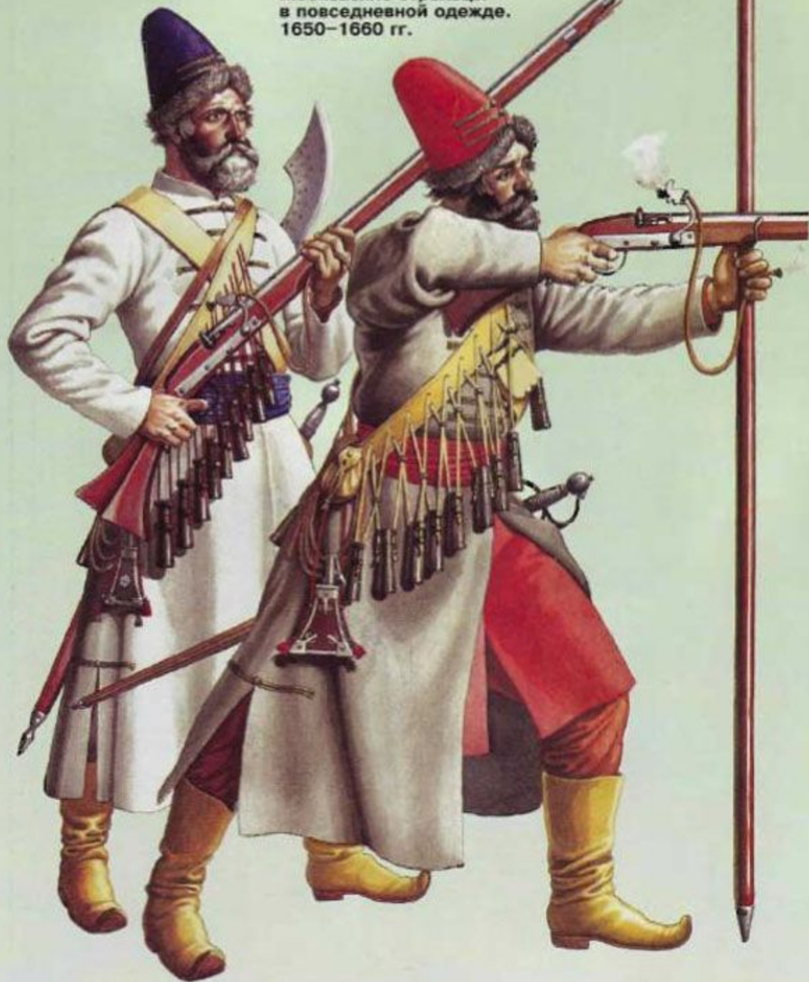
Московские стрельцы в повседневной одежде. 1650-1660 гг.