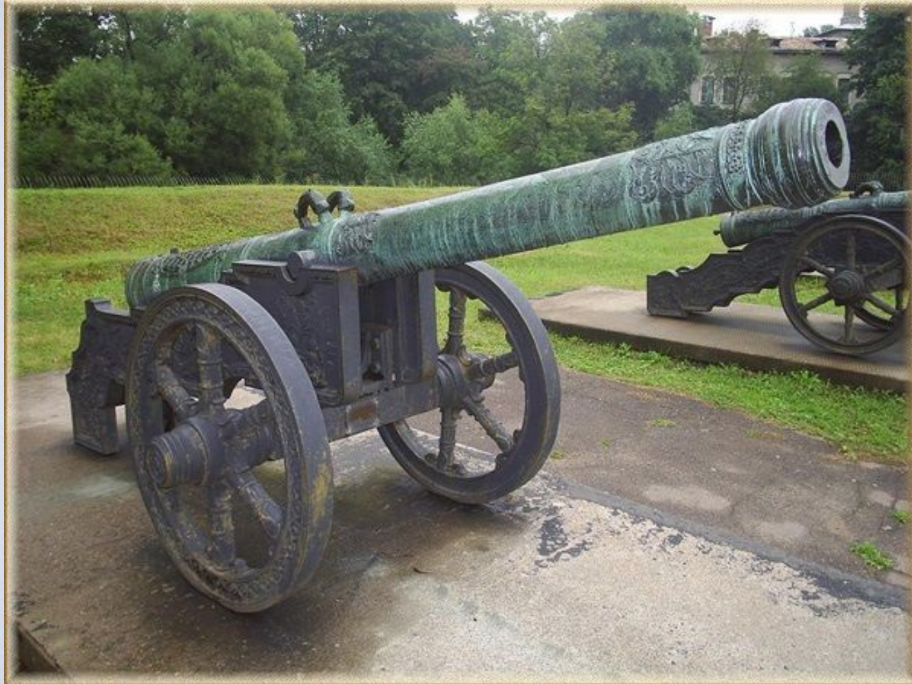
Крепостная бронзовая пищаль. Русское литьё XVI века.