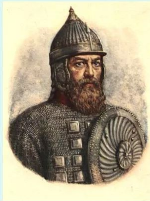
Князь Дмитрий Пожарский