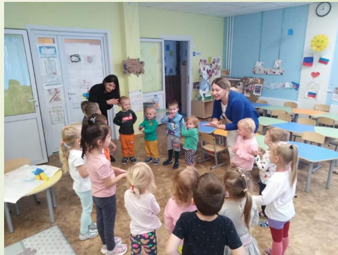
День открытых дверей