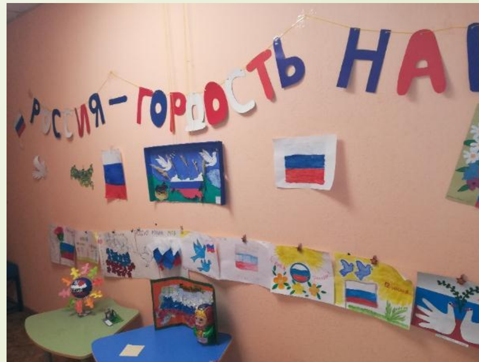
Родители вместе с детьми организовали выставку «Россия – гордость наша»