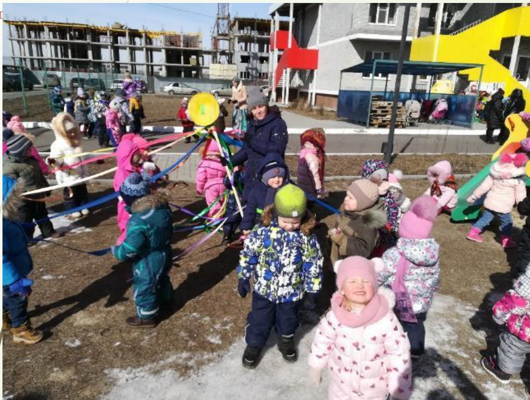
Масленица вместе с родителями