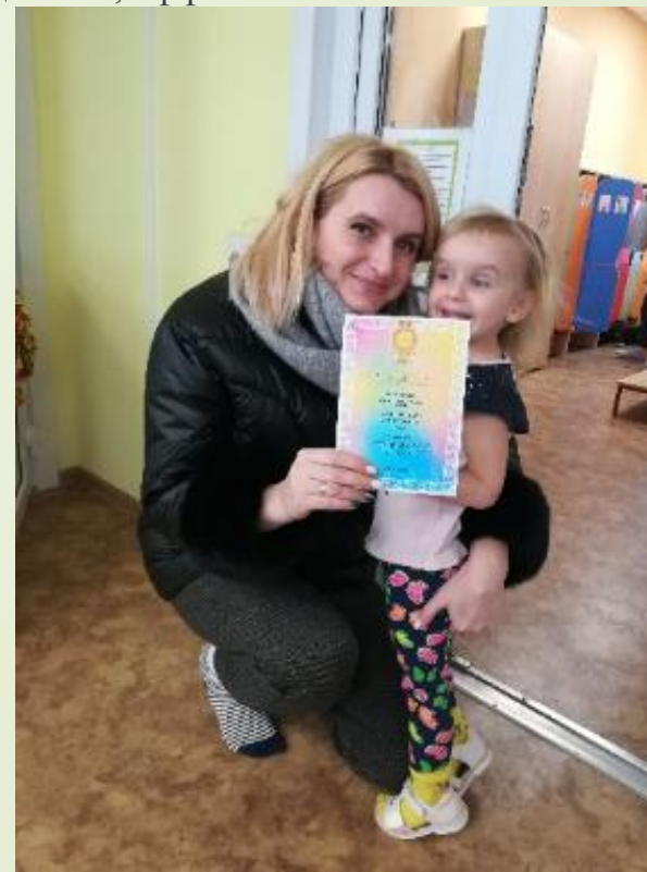
Самая спортивная семья в рамках ДОУ