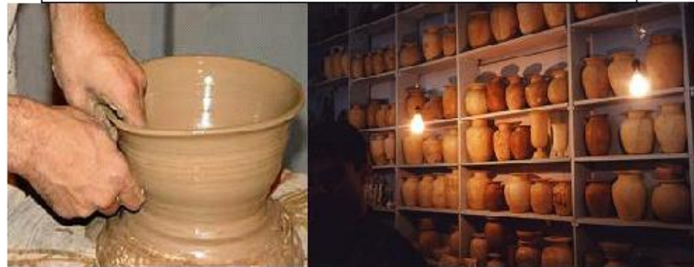
Гончарное и кирпичное производство