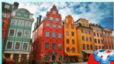
Старый город Гамла Стан