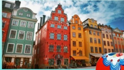
Старый город Гамла Стан