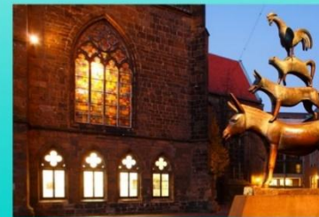
Памятник Бременским музыкантам