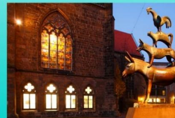
Памятник Бременским музыкантам