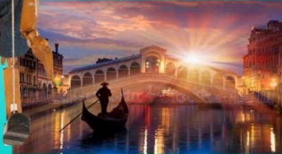
Мосты и каналы Венеции