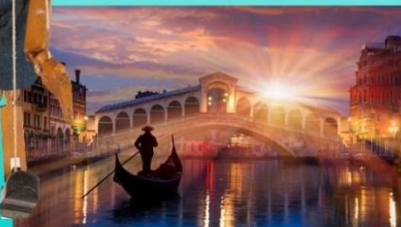
Мосты и каналы Венеции