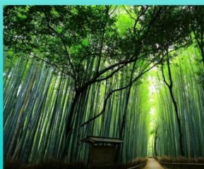
Бамбуковая роща Арасияма