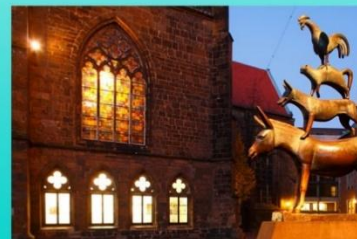
Памятник Бременским музыкантам