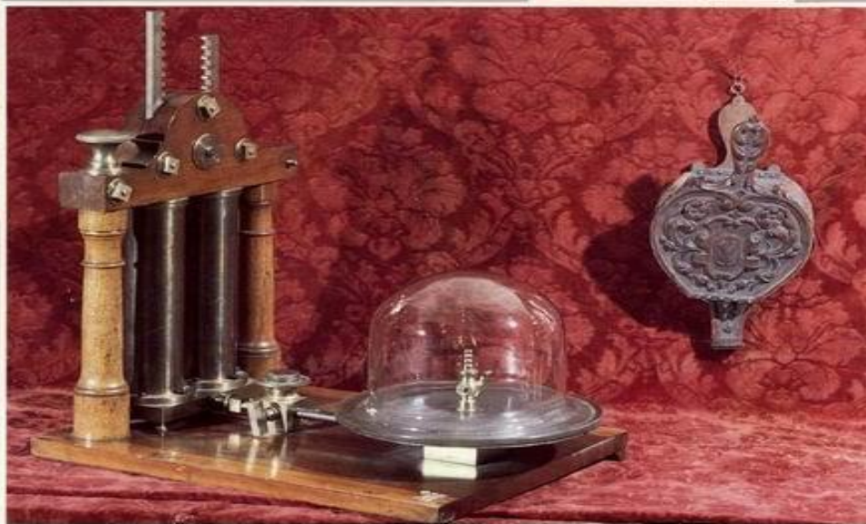
Вспомогательный аппарат XVIII в. Музей М.В.Ломоносова, Ленинград

Ломоносов считал химию своей «главной профессией», причем развитие химии, по мнению ученого, должно было помочь решению практических задач. «Истинный химик должен быть теоретиком и практиком», — писал он. Став профессором химии, Ломоносов начал добиваться создания химической лаборатории.