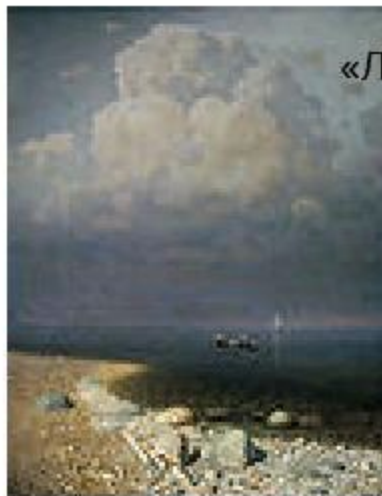
«Ладожское озеро» ( 1873 )

Архип Куинджи родился в Мариуполе, в семье бедного сапожника- грека . Рано лишился родителей и жил в большой бедности, пас гусей, служил у подрядчика по постройке церкви, потом у хлеботорговца; выучился у учителя-грека грамоте по-гречески, затем некоторое время посещал городское училище