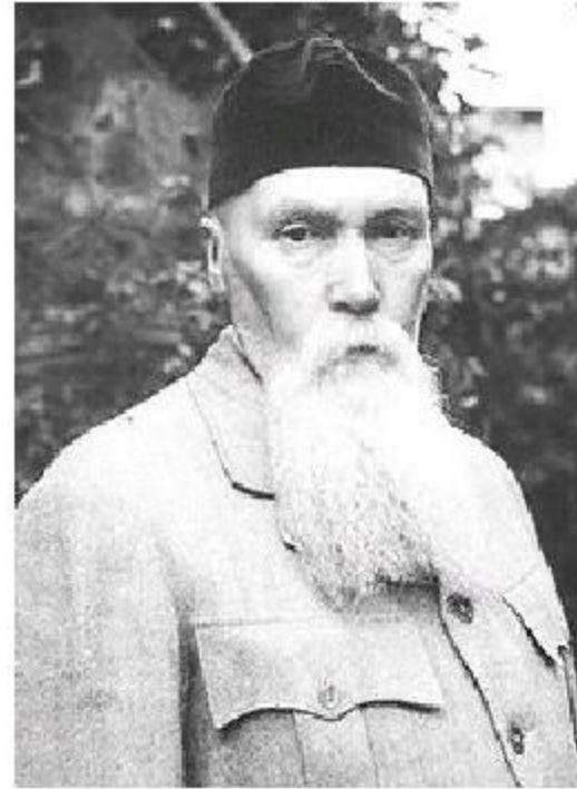
Николай Рерих (1940 - 1947 годы)