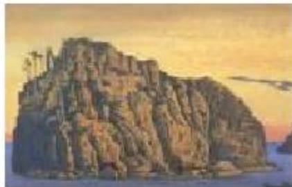
Н.К.Рерих. "Святой остров"

В 1916 году из-за тяжёлой болезни лёгких Н. К. Рерих по настоянию врачей вместе с семьёй переезжает в Финляндию ( Сердоболь ), на побережье Ладожского озера . Близость к Петрограду позволяла заниматься делами Школы Общества Поощрения Художеств