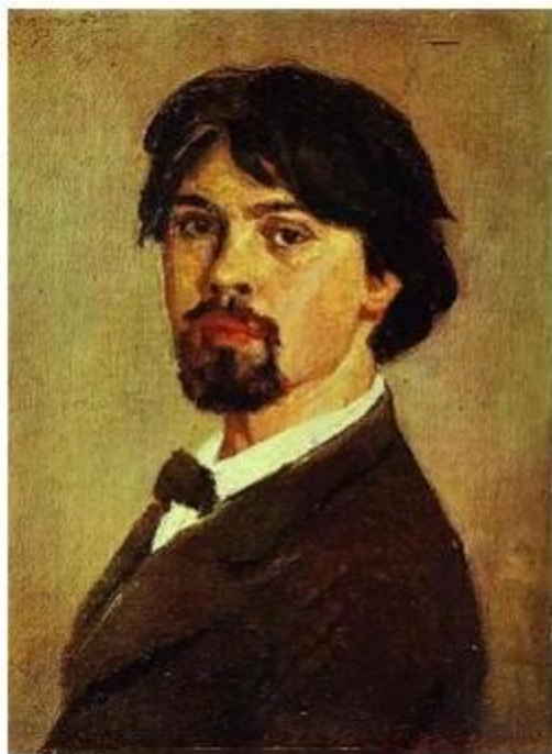
Василий Суриков родился 12 (24) января 1848 года в Красноярске , в казачьей семье

В 1881 году Суриков становится членом Товарищества передвижных художественных вы ставок