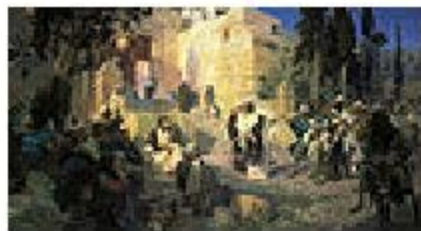
«Христос и грешница»

Василий Polenov родился 20 мая (1 июня) 1844 г. в Петербурге .