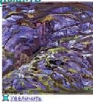
Н.К.Рерих. Карельский пейзаж