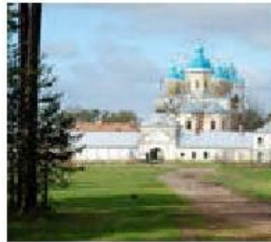
И.И.Шишкин. Вид на острове Валааме