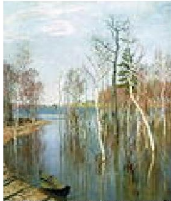
Весна. Большая вода, 1897

Левитан на несколько недель ездил в Финляндию , где написал картины: «Крепость. Финляндия» (крепость Олавинлинна в Савонлинне ), «Скалы, Финляндия», «Море. Финляндия», «Пунка-Харью . Финляндия» ( Пункахарью , в частном собрании). В течение 1897 года художник закончил картину «Остатки бывалого. Сумерки. Финляндия».