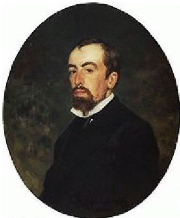
В. Д. Polenov. Портрет работы И. Репина (1877)