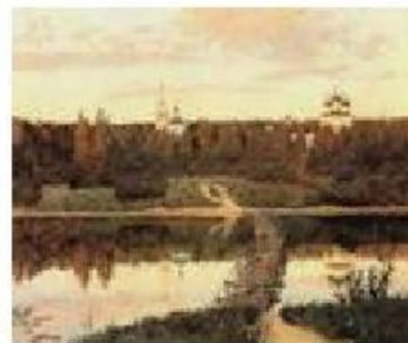
Тихая обитель. На острове Валааме . Архип Куинджи, 1873.