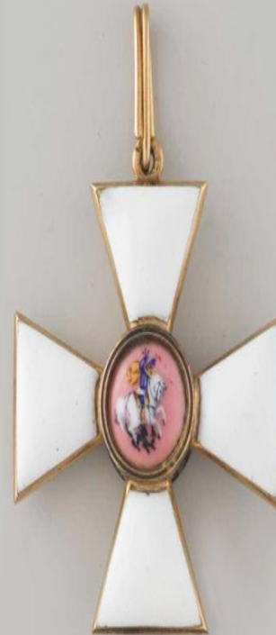
Знак 4-й степени