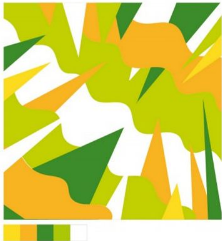
Цвет и эмоция. Лук (репчатый)