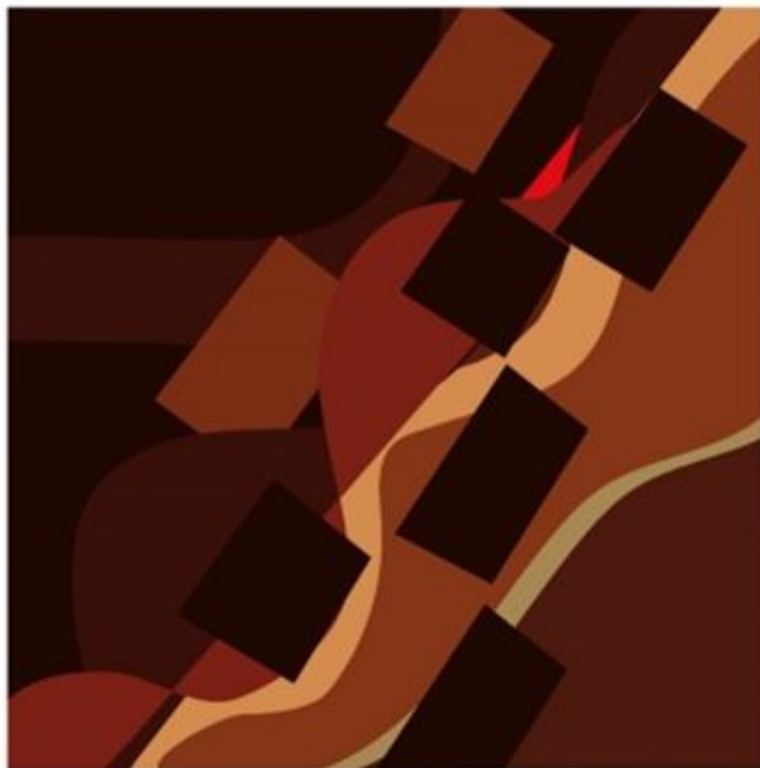
Цвет и эмоция Шоколад