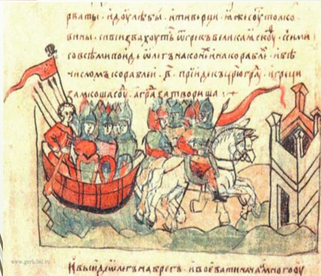
Поход Олега на Царьград. Миниатюра из Радзивилловской летописи. 13 век.