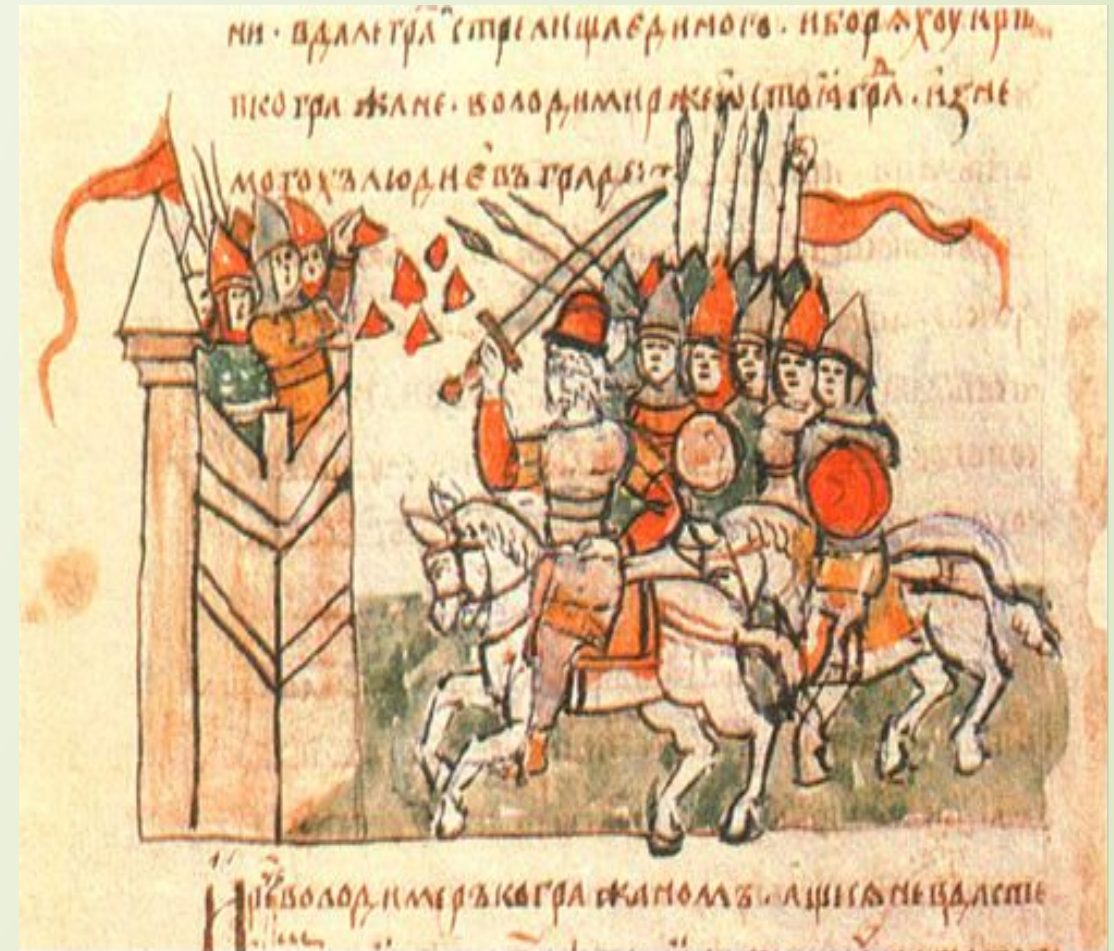
Осада Корсуня (Херсонеса) войском князя Владимира. Миниатюра из Радзивилловской летописи. 13 век.