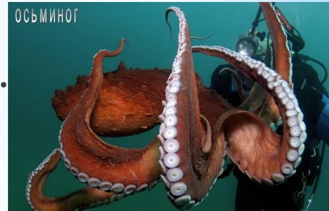
У осьминога три сердца: одно (главное) гонит голубую кровь по всему телу, а два других — жабрных — проталкивают кровь через жабры. Имеет 8 щупалец, они покрыты присосками, которые помогают ему прикрепляться к скалам.

отвлечь внимание хищника, а сам в это время дать дёру что есть мочи.