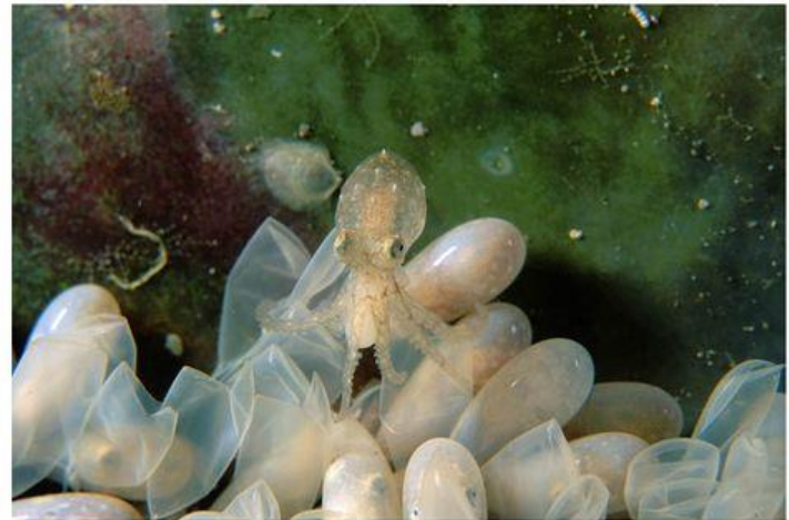
А это вылупился маленький осьминожек

Осьминог может изменять окраску в зависимости от настроения – когда испуган – белеет, разгневан – краснеет, а в обычном состоянии – коричневого цвета.