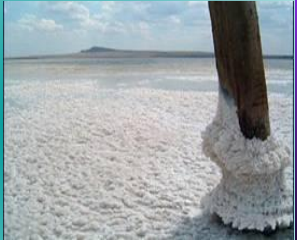
из соленых озер