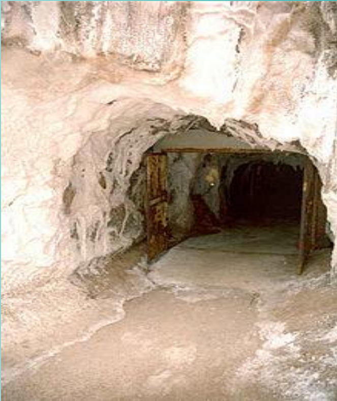
из соляных шахт