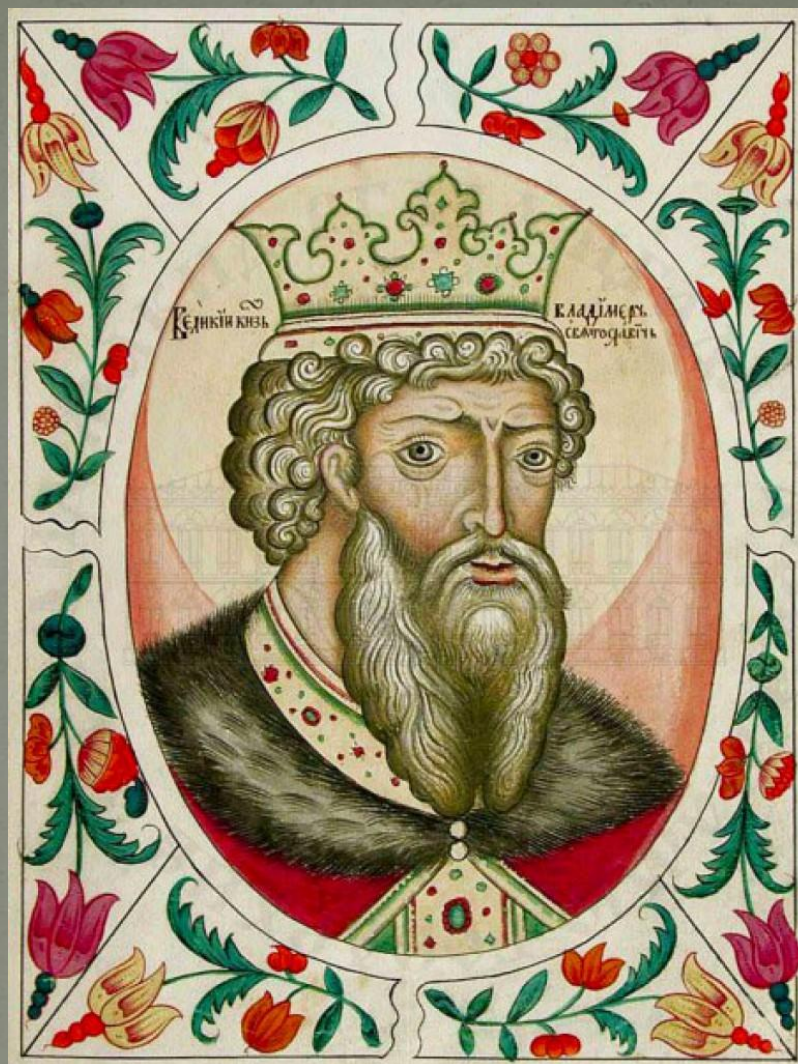
Князь Владимир Красное Солнышко