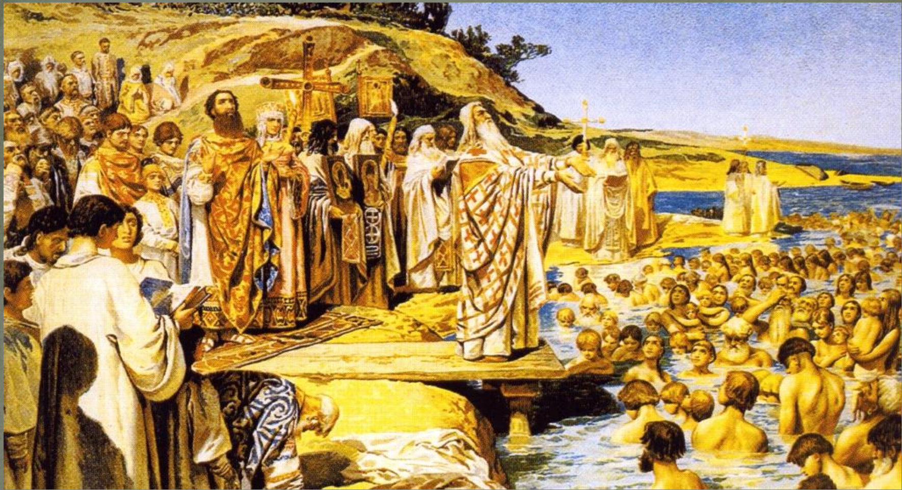
Крещение киевлян. Художник К.В.Лебедев