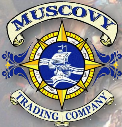
МОСКОВСКАЯ ТОРГОВАЯ КОМПАНИЯ

Быстрыми темпами набирала обороты торговля . Купцы становились все более уважаемыми людьми. Создавались и успешно действовали морские торговые компании, они распространяли свое влияние по всему миру.