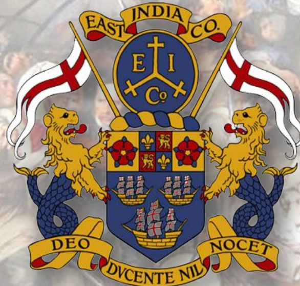
ОСТ-ИНДСКАЯ ТОРГОВАЯ КОМПАНИЯ