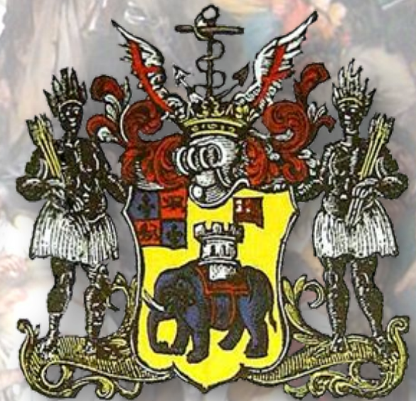
АФРИКАНСКАЯ ТОРГОВАЯ КОМПАНИЯ