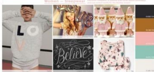
Inspiration & Colour

WGSN для новогодних коллекций предлагает палитру в традиционных уютных девчачьих пастельных тонах. Когда можно поделиться секретами, и всего неговя, сделать новогоднее украшение. Уюта девчачьих розовый, лентиль, золото и темный как шоколад фиолетовый.