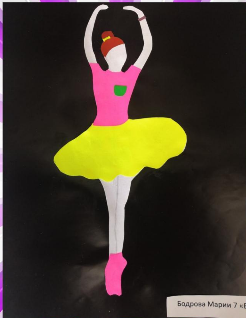
Бодрова Мари 7 «Б