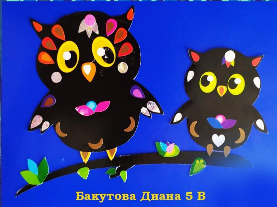
Бакутова Диана 5 В