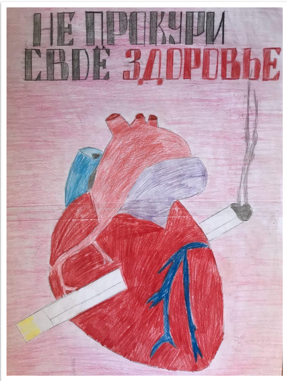
Ложкина М. 8 б класс