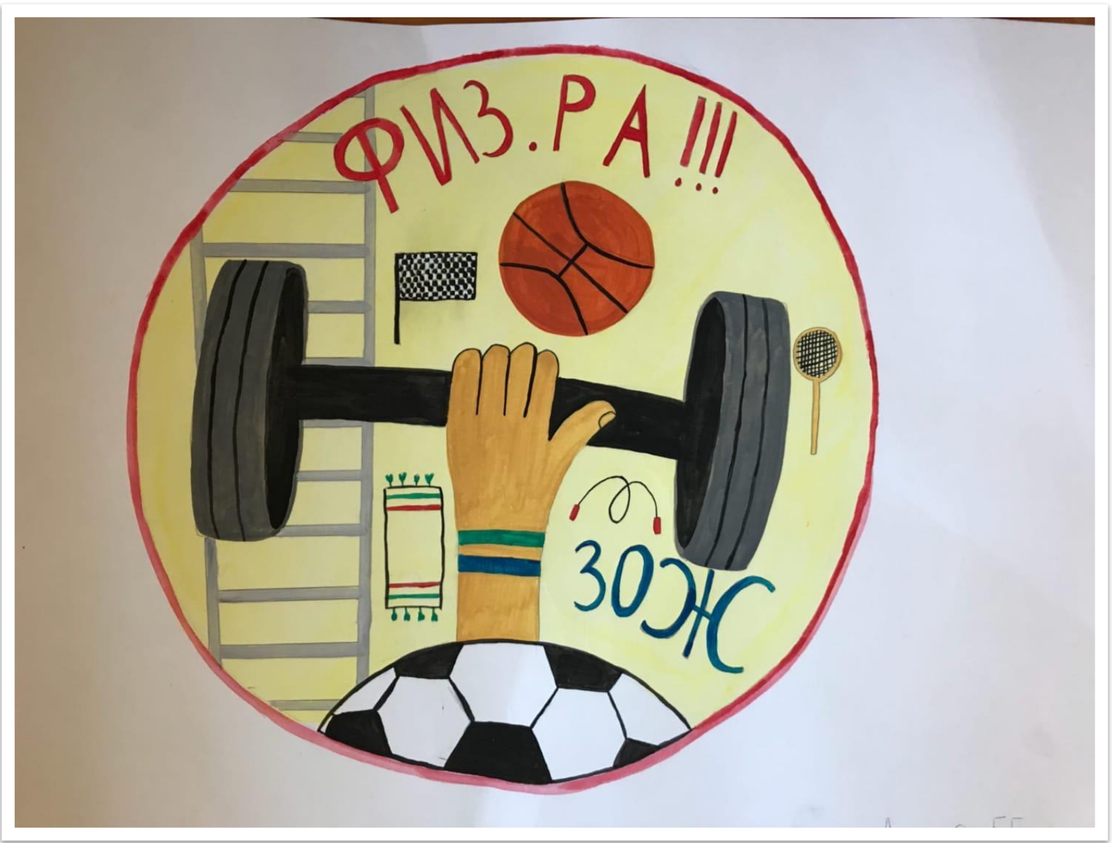
Драчук С. 5 б класс