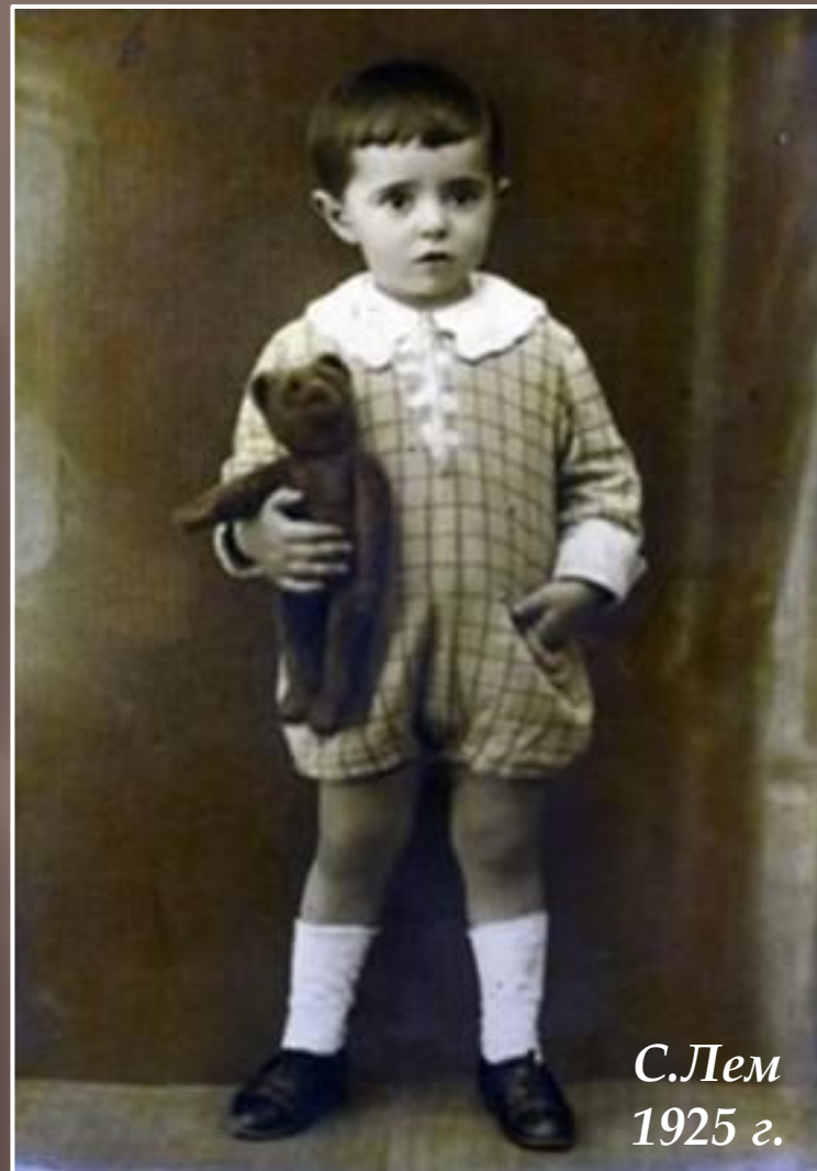
С.Лем 1925 г.