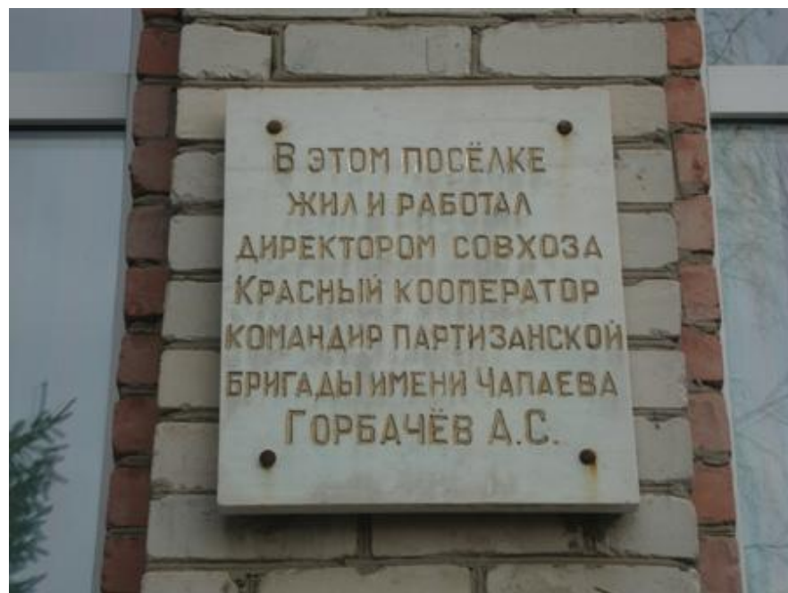
Памятная доска на здании Мичуринской школы