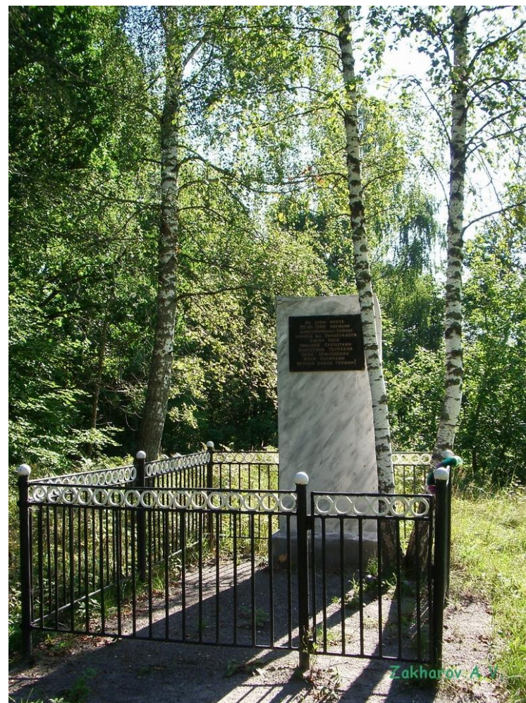
Памятник погибшим комсомольцам до и после реконструкции