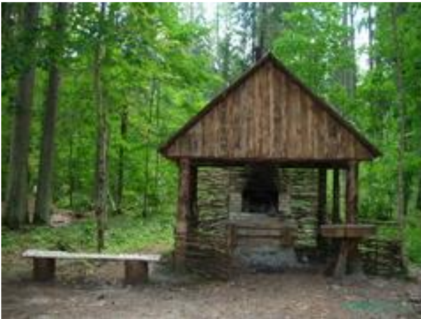
Печь для выпечки хлеба, на территории основной стоянки партизанского отряда им. Виноградова.