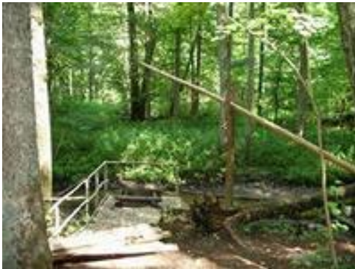
Партизанский колодец на реке Сенне.