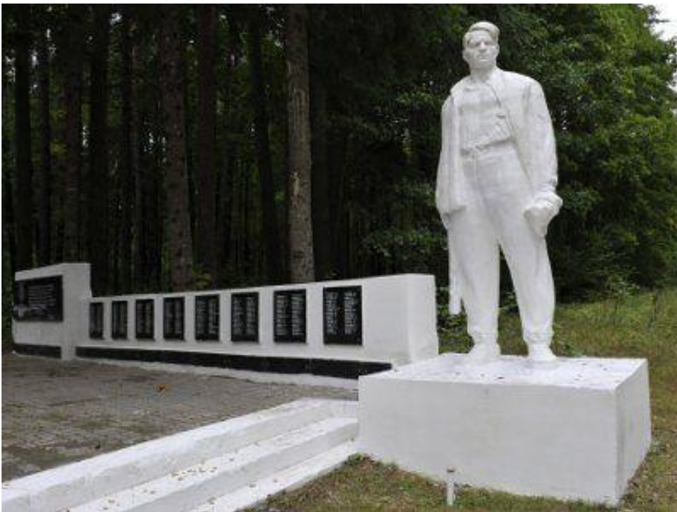
Стена памяти, на которой высечены имена погибших партизан отряда.