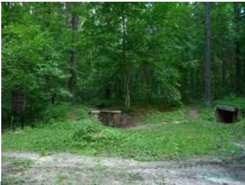
Землянки партизанского отряда «Красный кооператор»