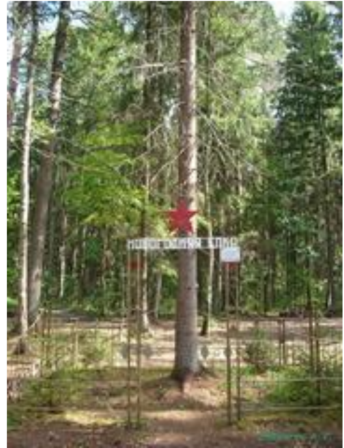
Партизанская новогодняя елка