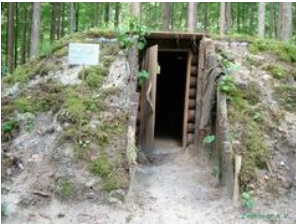
Землянка медсанчасти партизанского отряда