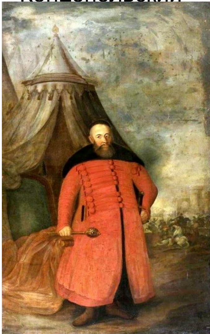
Великий коронный гетман Станислав Концепольский