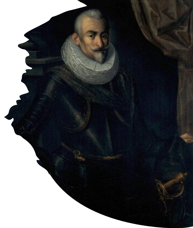
Иоганн фон Тилли