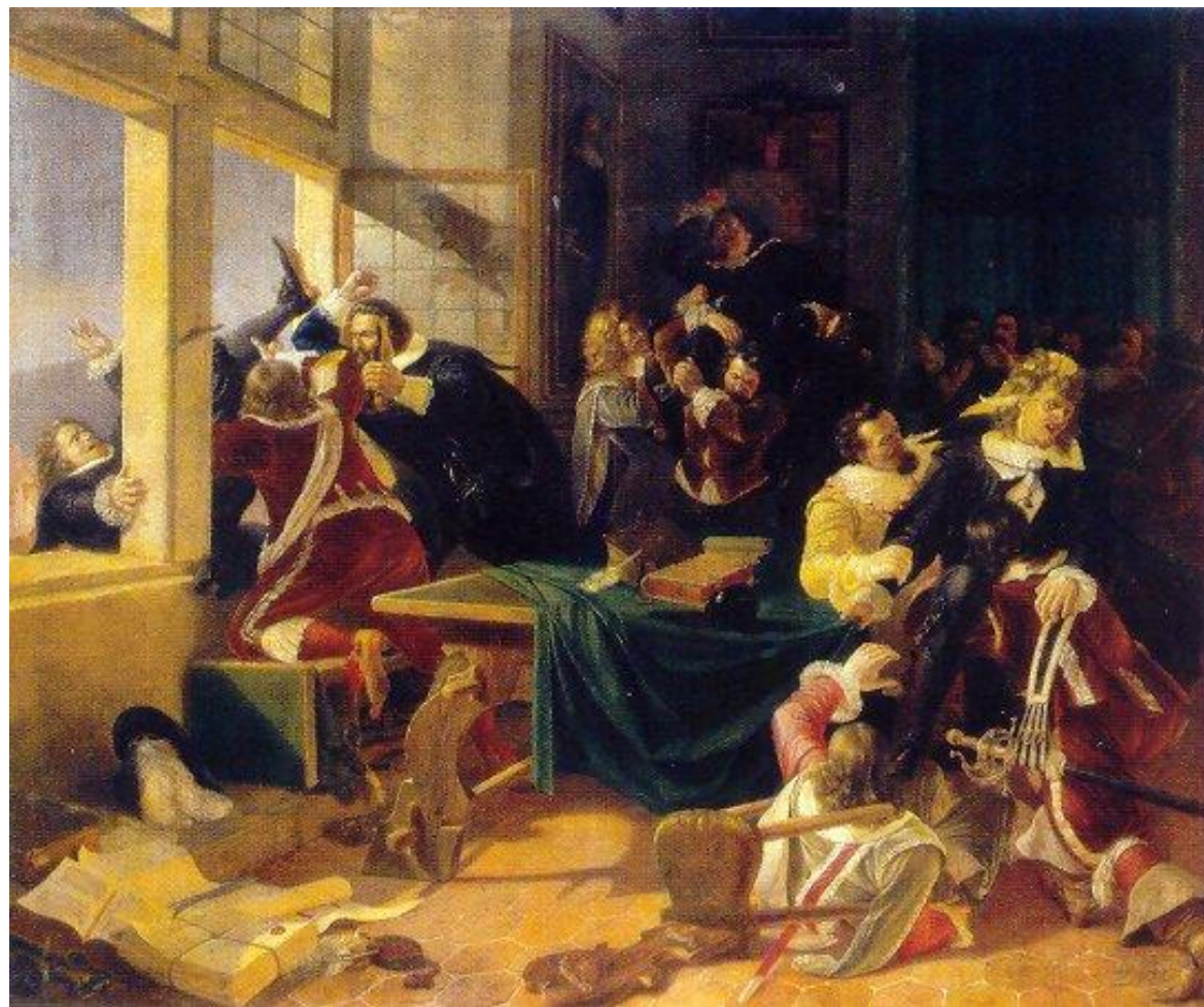
Пражская дефенестрация 23 мая 1618 года