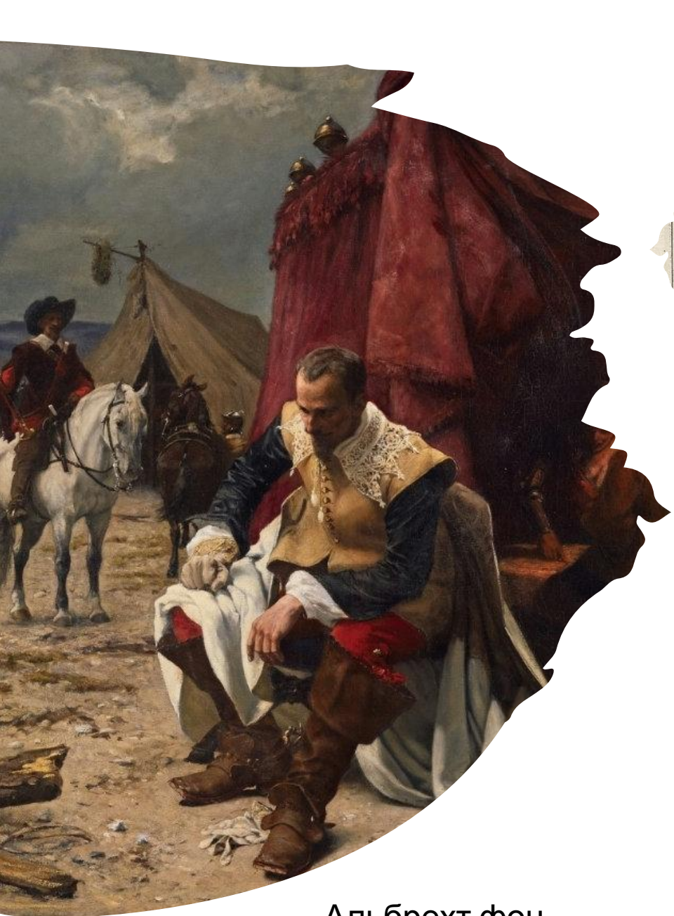
Альбрехт фон Валленштейн