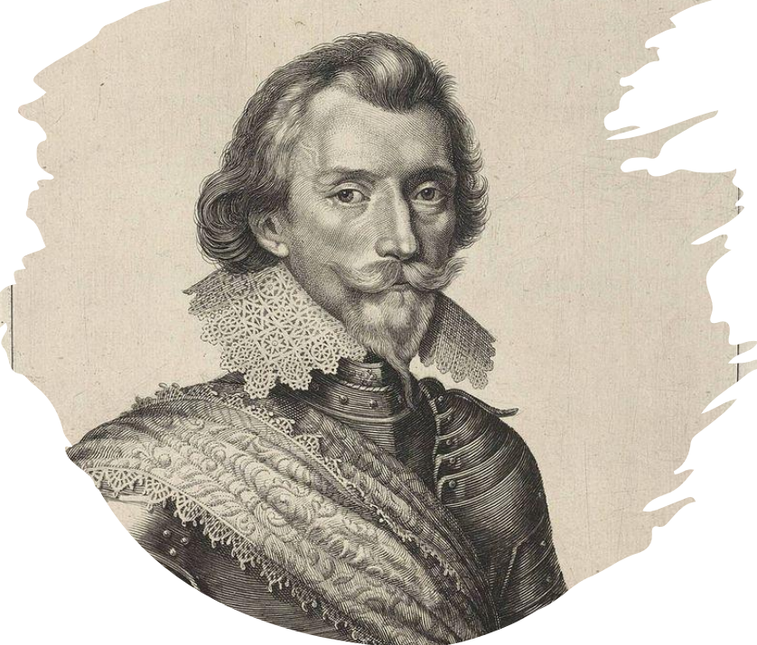
Петер фон Мансфельд