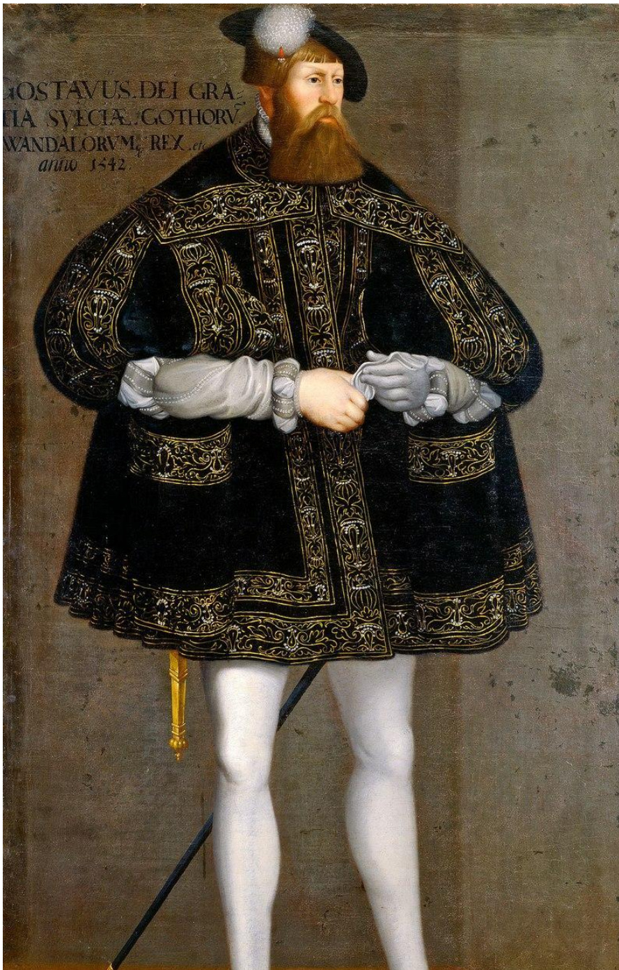
Густав I Васа (1523-1560)