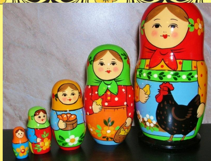
Загорский (Сергиев – Посад г. Загорск.)