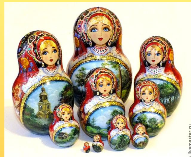
С живописными пейзажами