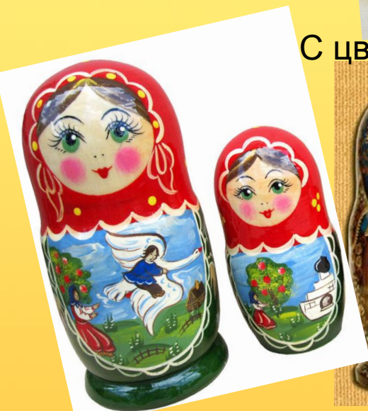
С сюжетами из народных сказок