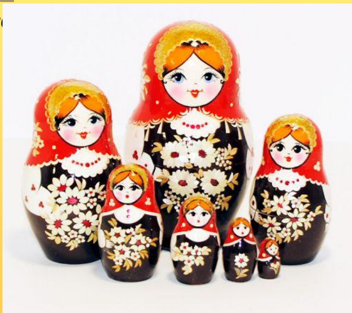
Вятский (г. Вятка)