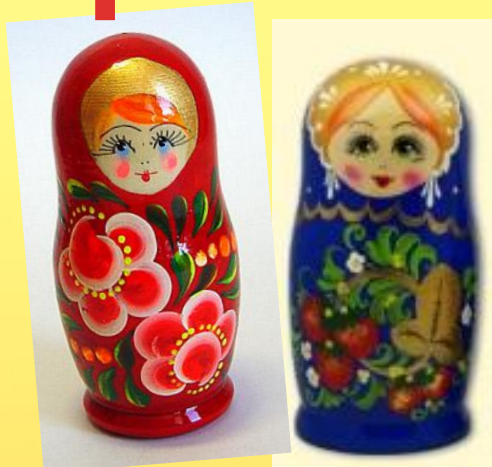
С цветочными узорами