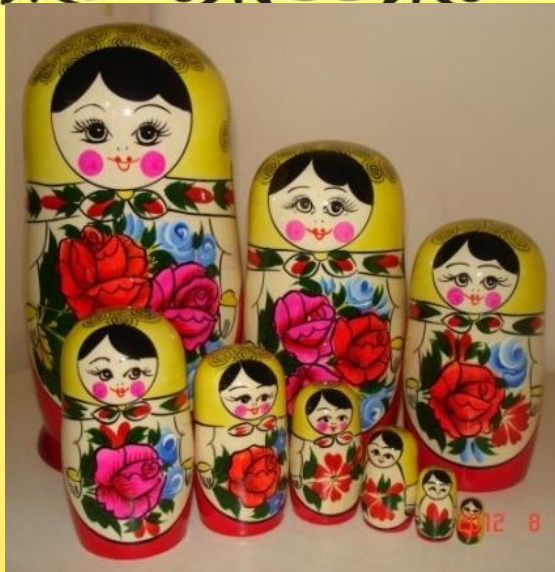
Семеновский (г. Семенов)