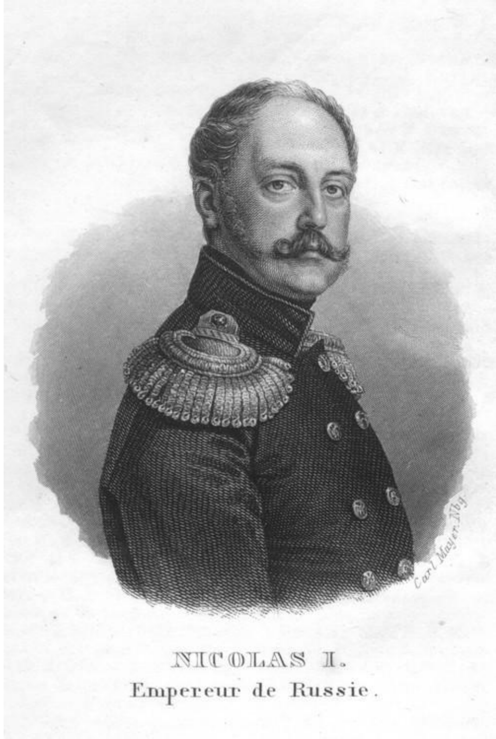
NICOLAS I. Empereur de Russie.