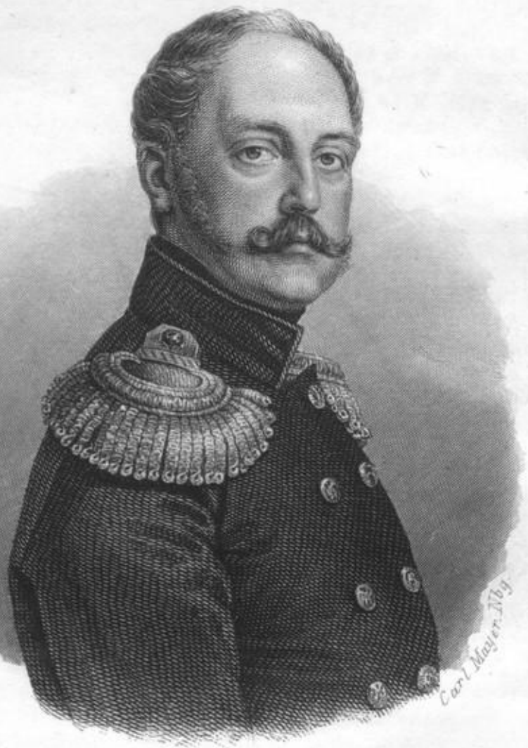
NICOLAS I. Empereur de Russie.