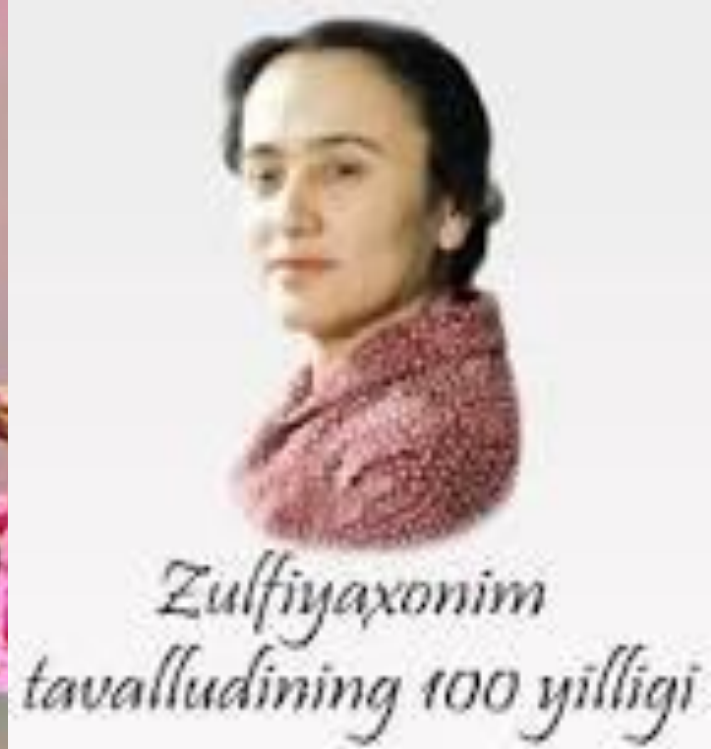
Zulfiyaxonim tavalludining 100 yilligi