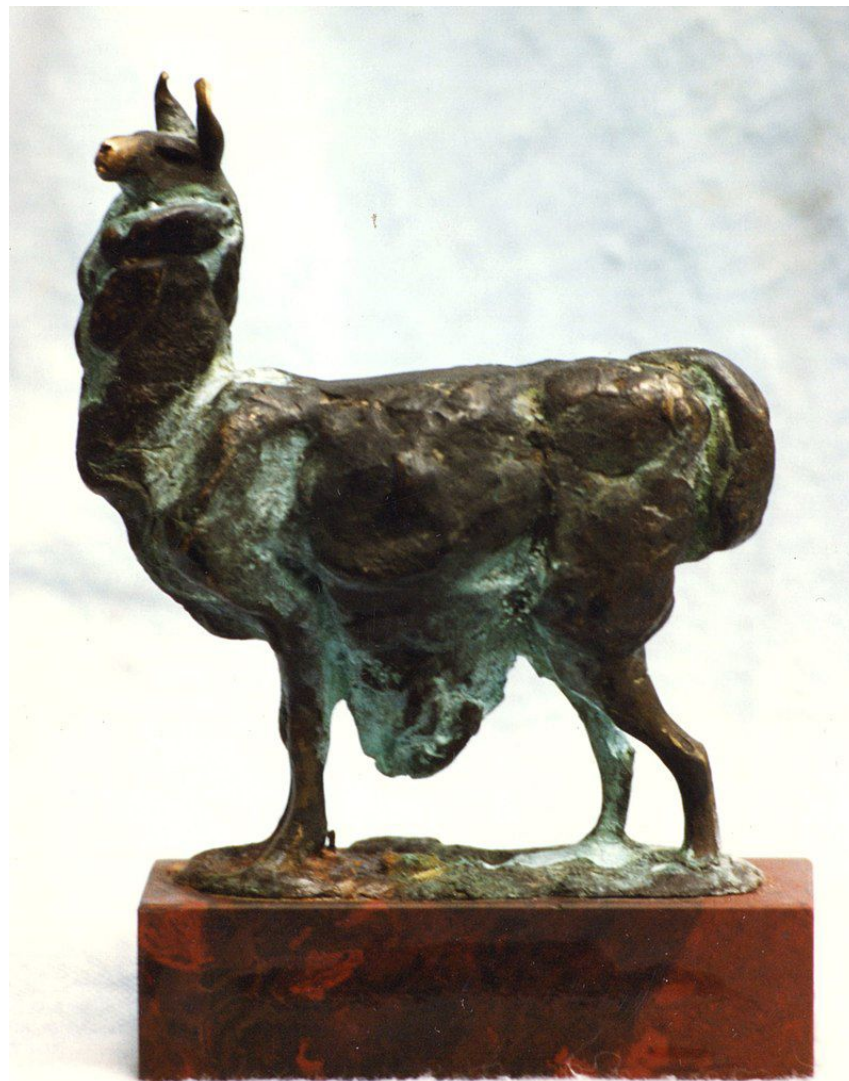
Лама (бронза, яшма)