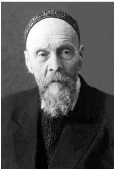
Ватагин Василий Алексеевич (1884–1969)