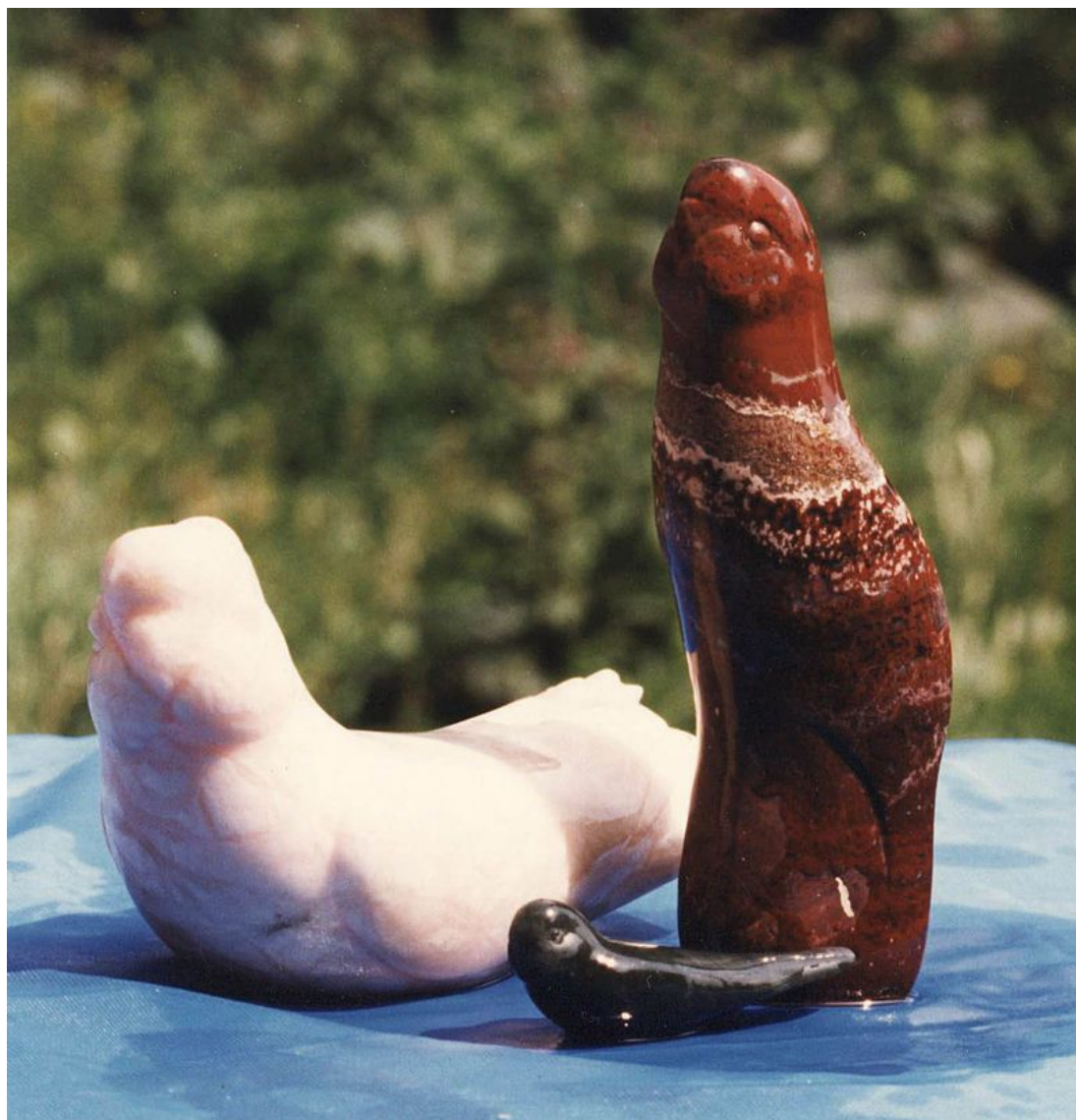
Птички (ангидрит, яшма)