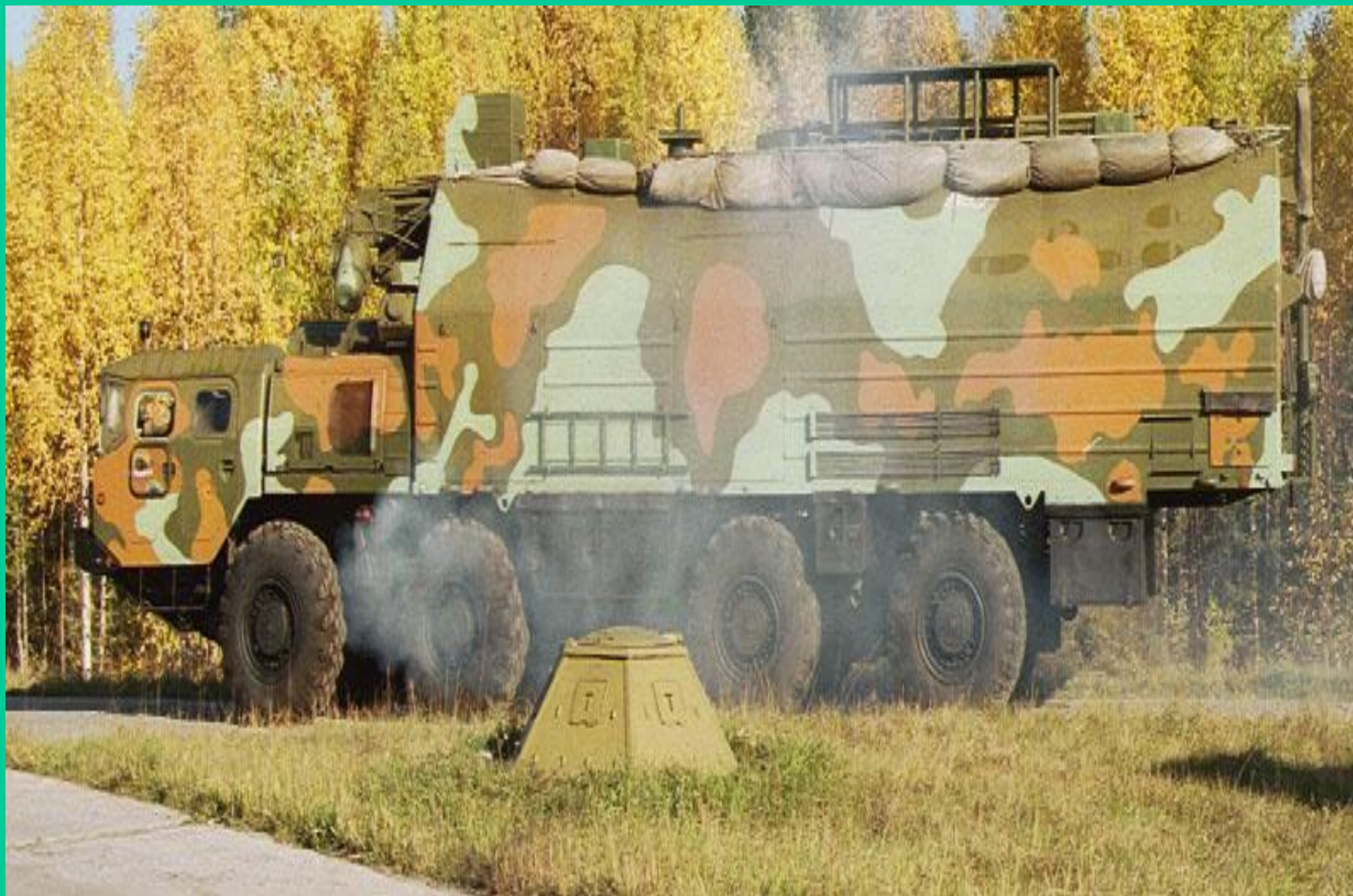
машина боевого управления ракетных войск