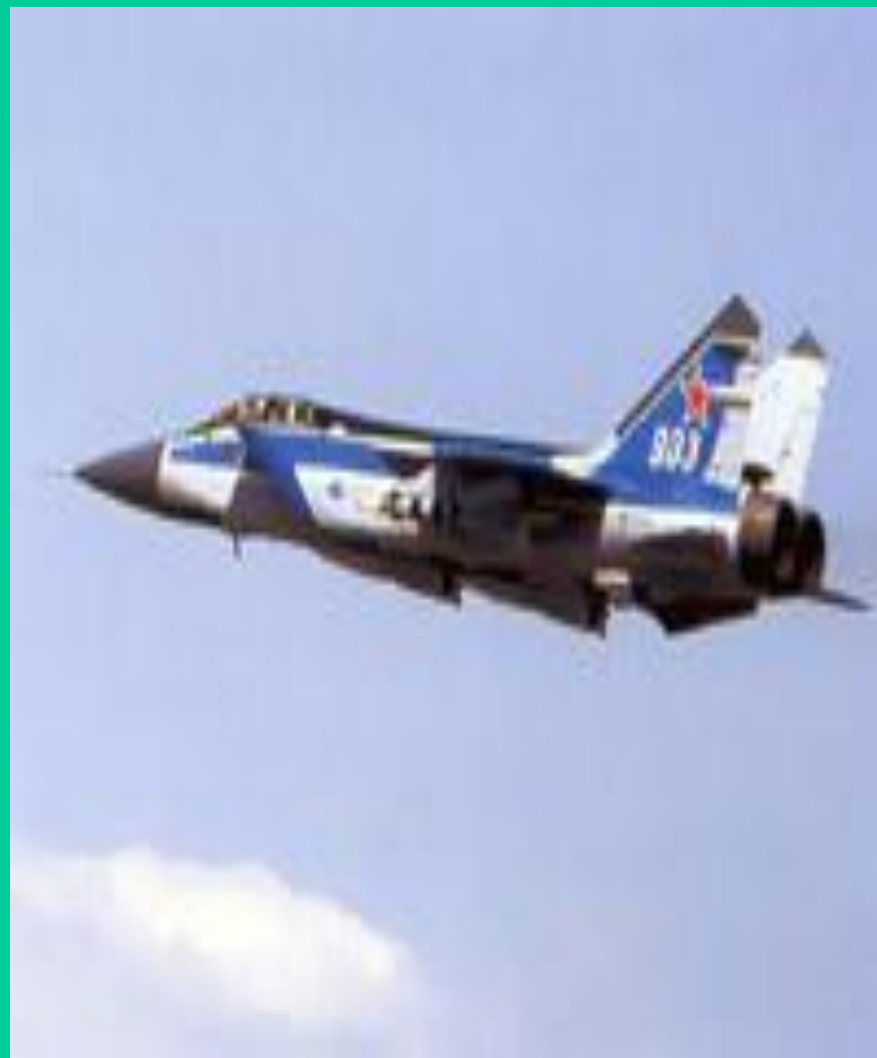
самолёт - истребитель