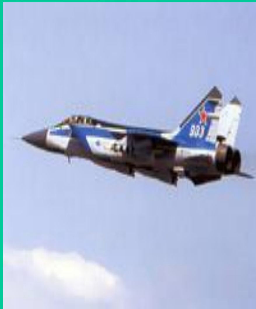
самолёт - истребитель