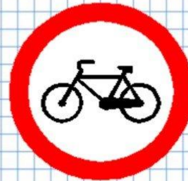
Движение на велосипеде запрещено