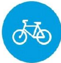
Знак 4.4 «Велосипедная дорожка»