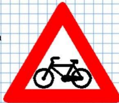
Пересечение с велосипедной дорожкой