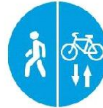
Знак комбинированный с указанием направления движения «Пешеходная / велосипедная дорожки»