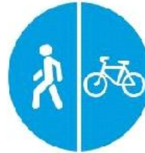
Знак комбинированный «Пешеходная / велосипедная дорожки»