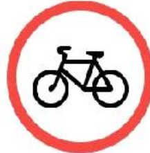
Знак 3.9 «Движение на велосипедах запрещено»