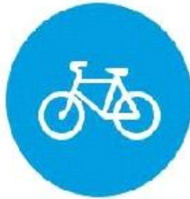
Знак 4.4 «Велосипедная дорожка»