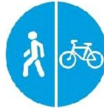
Знак комбинированный «Пешеходная / велосипедная дорожки»