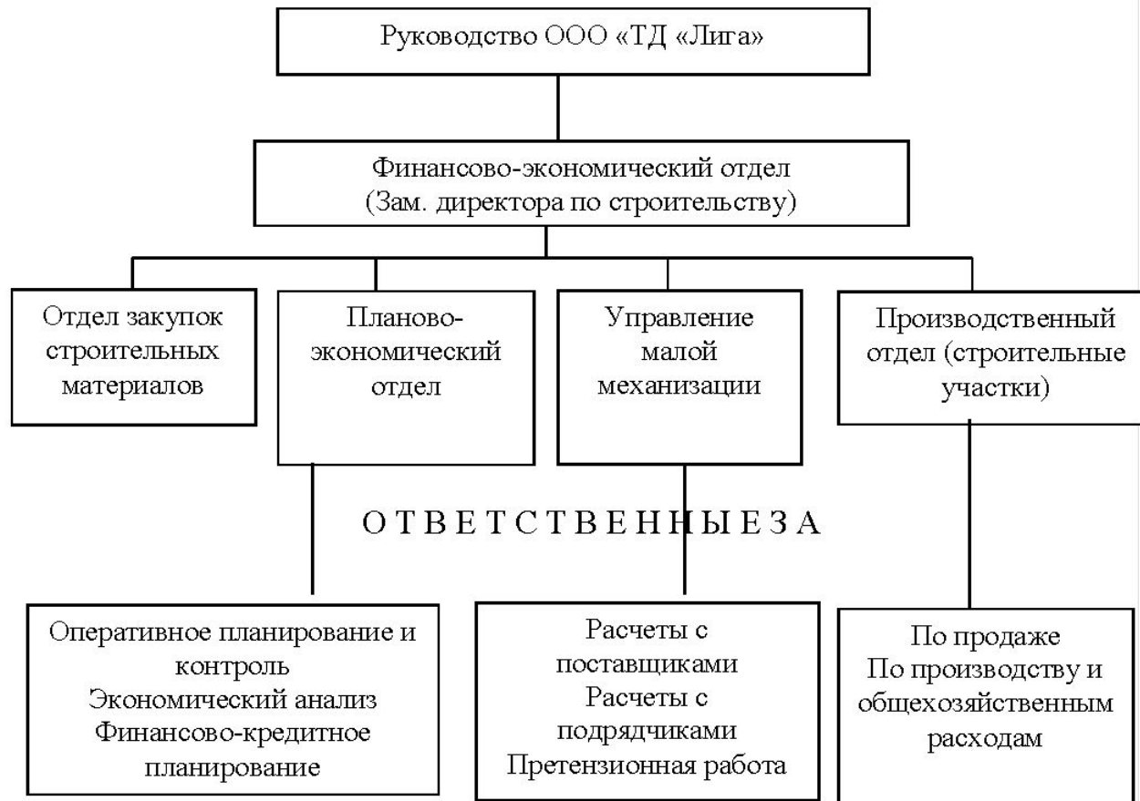
Рисунок 3 – Перспективная финансово-экономическая модель управления финансами и финансовыми рисками ООО «ТД «Лига»