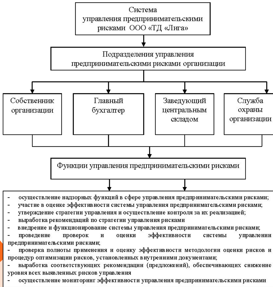
Рисунок 2 – Организационная и функциональная схема управления предпринимательскими рисками ООО «ТД «Лига»