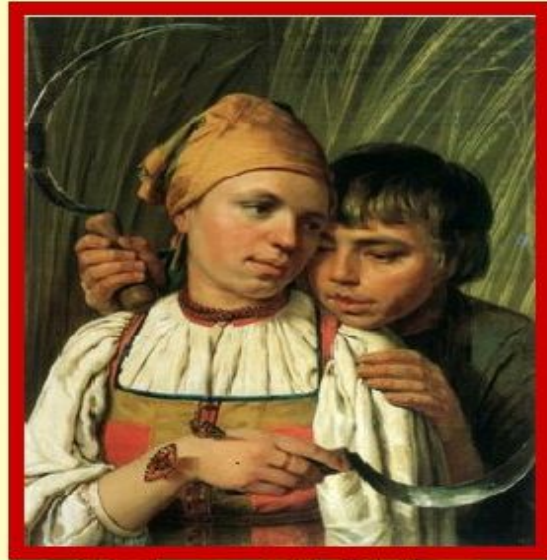
А.Г. Венецианов. Жнецы