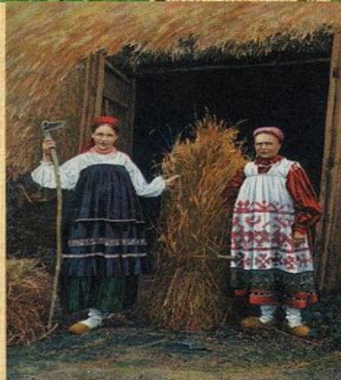
Последний сноп. Фото начала XX в.