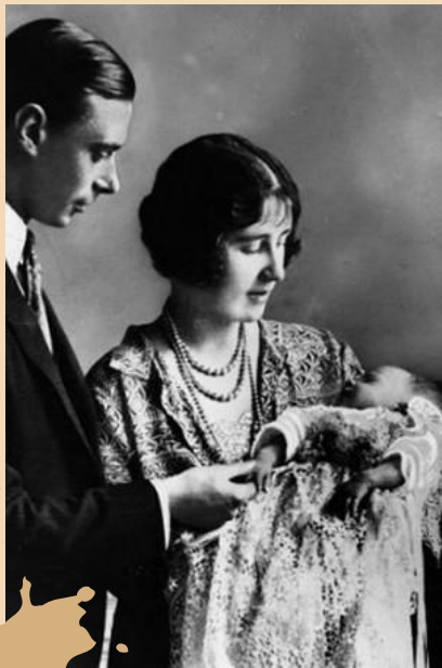
Будущий король Георг VI с женой и первенцем