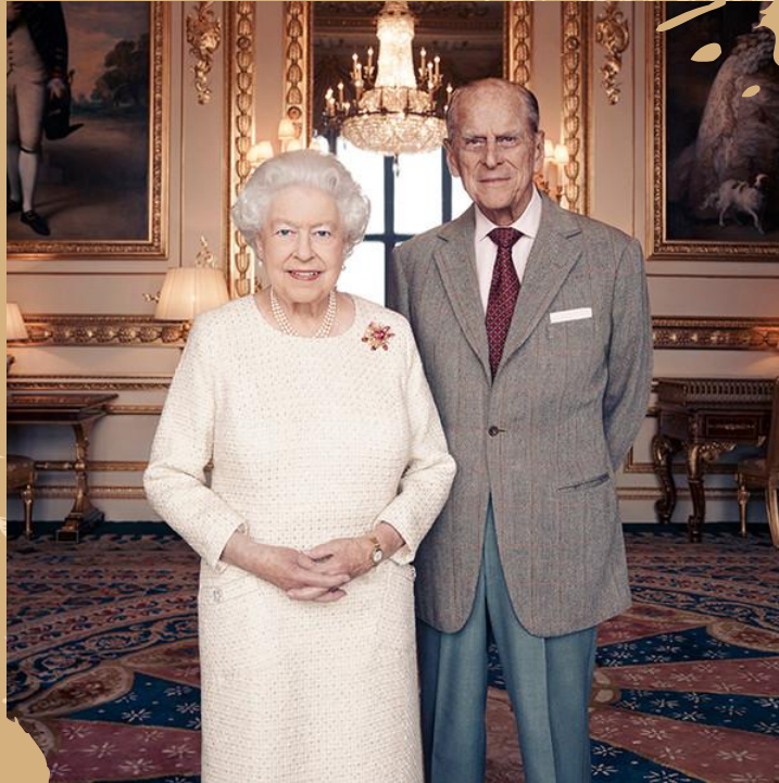
Юбилейный портрет Елизаветы II и принца Филиппа, сделанный к 70-летию со дня их свадьбы. Ноябрь 2017 года

Сегодня в королевском доме спокойно. Королева много времени проводит в своем поместье, где гуляет под руку с любимым супругом, занимается дрессировкой собак, выращивает лошадей, и не любит, когда нарушают их с Филиппом уединение.