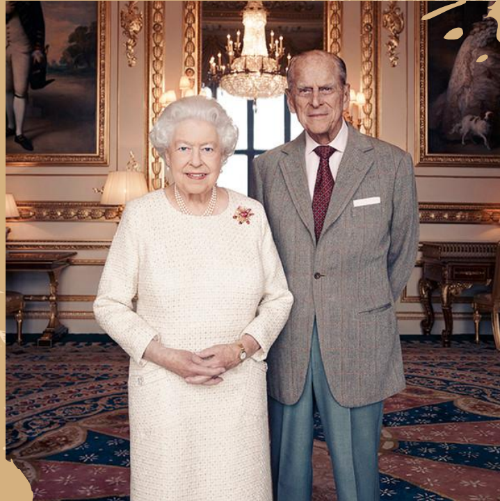
Юбилейный портрет Елизаветы II и принца Филиппа, сделанный к 70-летию со дня их свадьбы. Ноябрь 2017 года

Сегодня в королевском доме спокойно. Королева много времени проводит в своем поместье, где гуляет под руку с любимым супругом, занимается дрессировкой собак, выращивает лошадей, и не любит, когда нарушают их с Филиппом уединение.